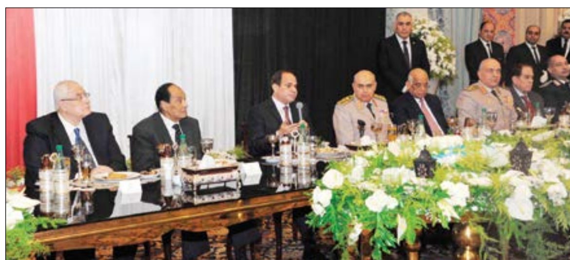
الرئيس عبد الفتاح السيسي متحدثاً خلال إفطار القوات المسلحة في ذكرى نصر العاشر من رمضان