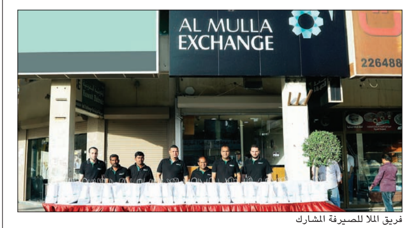
فريق الملا للصيرفة المشارك

مع 72 فرعاً في مختلف أنحاء الكويت، تتمركز شركة الملا للصيرفة في القمة مقارنة بالشركات المماثلة. وتلعب التكنولوجيا والتقنيات المتطورة والخدمة المتميزة للعملاء إلى جانب الحملات التسويقية المبتكرة التي تقدمها الشركة دوراً كبيراً في تعزيز مكانتها الرائدة في ظل التنافسية العالية التي يشهدها سوق الكويت في مجال تحويل الأموال.