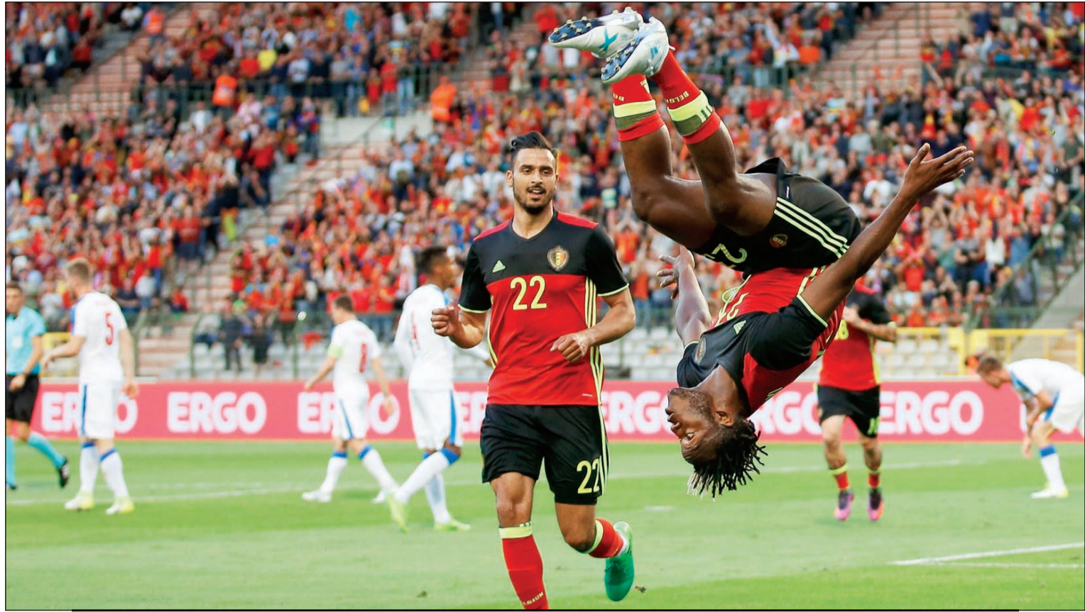
باتشواي يحتفل على طريقته