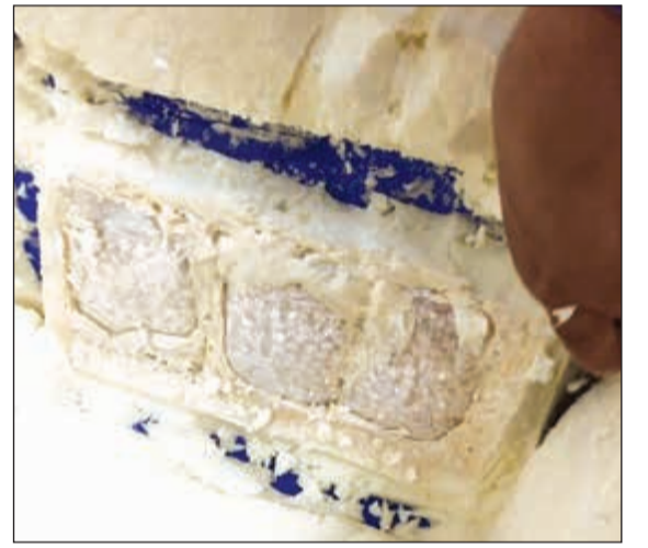
صندوق الآيس بوكس الذي أخفيت فيه الحبوب