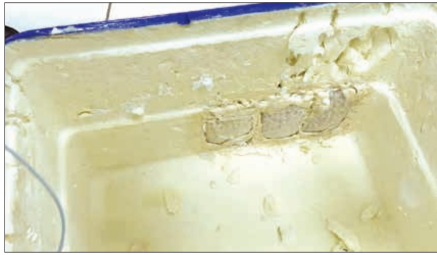
صندوق الآيس بوكس