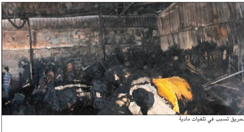
الحريق تسبب في تلفيات مادية

وضعت حراسة حول نحو 100 برميل لاحتوائها على مادة كيميائية وذلك للوقوف على نوعية هذه المادة واستخداماتها، وجرى إخطار مركز إطفاء المواد الخطرة التابع للإدارة العامة للإطفاء حيث انتقل رجال المركز وجار معاينة المحتويات باستخدام ما يمتلكه هذا