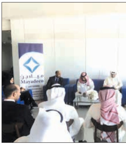
جانب من «العمومية»

قال رئيس مجلس إدارة شركة ميادين الوطنية الشيخ صباح الصبحان إن استراتيجية الشركة تهدف خلال العام المقبل لتزويد مسوق سواء لجهة توسعاتها أو في أنشطتها التشغيلية. وأضاف الشيخ صباح خلال الجمعية العمومية العادية وغير العادية للشركة أن ميادين نجحت خلال 2017 في تنفيذ غالبية الخطط التي وعدت بها مساهمينا، مشيراً إلى أن السياسة الإصلاحية التي تبنتها الإدارة الجديدة أسهمت في تحقيق العديد من النتائج الإيجابية وعلى رأسها تنشيط المبيعات وضغط الإيرادات بشكل انعكس إيجاباً ومباشرة على نتائج أعمالها. وقال الشيخ صباح إن سقق طموحات ميادين ارتفع في عام 2017 كثيراً وتجاوز تطوير خدماتها ما قاد إلى إضافة المزيد من المشاريع إلى أنشطتها التشغيلية تمكينها من تجاوز المساهمة في تطوير الرياضة بشكل عام في الكويت ورياضة الرماية بصفة خاصة. وشدد الشيخ صباح على أن ميادين تسعى إلى الارتقاء بأنشطتها بما يسهم في بناء جيل ساعد قادر على المنافسة ليس فقط في ميادين الرماية، بل في كل ميادين الرياضة وميادين العمل والإنتاج في الكويت وفي كل المحافل الدولية. وأشار الشيخ صباح إلى انه على صعيد مؤشرات الأداء المالي تمكنت ميادين من زيادة إيراداتها بنسبة 23٪، فيما نجحت في تخفيض مصروفاتها بنسبة 18٪، منوهاً إلى أن الإدارة التنفيذية استطاعت في الوقت نفسه خفض المصروفات العمومية