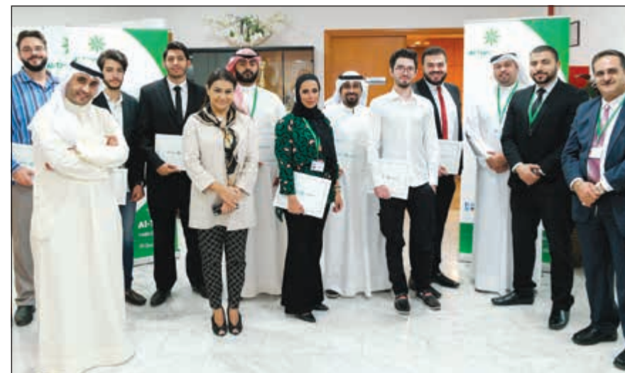
لقطة تذكارية مع خريجي أكاديمية «التجاري»

شاركت زين الشركة الرائدة في تقديم خدمات الاتصالات المتنقلة في الكويت موظفي مركز الاتصال (107) مأدبة الإفطار الرمضانية تقديرا لجهودهم وتفانيهم في العمل خلال شهر رمضان المبارك وفي فترة الإفطار على وجه الخصوص، وذلك بحضور الرئيس التنفيذي إيمان الروضان والإدارة التنفيذية من مختلف قطاعات الشركة. وذكرت الشركة في بيان صحفي أن هذه المبادرة السنوية تأتي تحت مظلة استراتيجيتها التحفيزية التي تهدف من خلالها إلى توطيد الصلة بين موظفيها وتقدير الجهود التي يبذلونها، وخاصة أولئك الذين يعملون على مدار الساعة وطوال أيام الأسبوع في مركز الاتصال (107) لتقديم أفضل مستويات خدمة العملاء لأكبر قاعدة مشتركين في الكويت. وأوضحت زين أن الإدارة التنفيذية وفي مقدمتها الرئيس التنفيذي إيمان