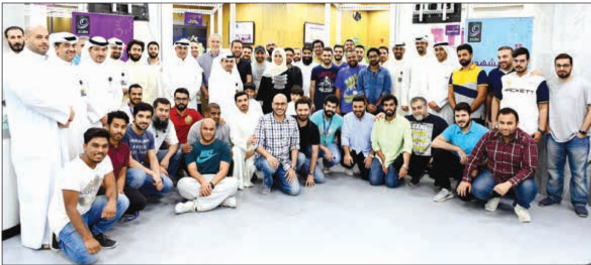
الروضان ومسؤولو «زين» مع موظفي مركز خدمة العملاء

الوقت على أن قطاع الموارد البشرية هو بمنزلة القوة الدافعة لحركة التشغيل لأي شركة أو مؤسسة، معتبرة أن الارتقاء بثقافة عمل المؤسسة يمثل دائما الخطوة الأولى في رحلة التفوق والنجاح. وأكدت زين أن العنصر البشري هو حجر الأساس التي تعتمد عليه المؤسسات الكبرى في تعزيز خططها التشغيلية والتجارية، وهو القاعدة الحقيقية لبناء الهيكل الإداري لأي مؤسسة والتي تحتاجها في مواجهة التحديات أثناء تنفيذها خططها الرئيسية. وأفادت الشركة بأن التزامها المستمر في تقديم قيمة مضافة للمجتمع، هو ما يجعلها تحرص على تناول القضايا الأكثر تأثيرا في الحياة، مبيئة أن حملتها الرمضانية «زين الشهور» تأتي لتترجم هذا التوجه، حيث تحمل معها رسالة تحث على التقارب والترحم والمشاركة في الحياة ونشر السلام في العالم.