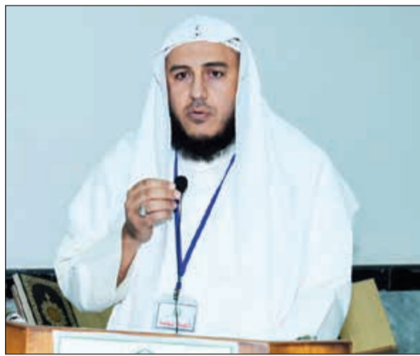
الشيخ مصطفى أبو الحسين