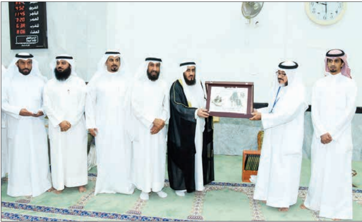
تكريم وكيل وزارة الأوقاف م. فريد أسد عمادي