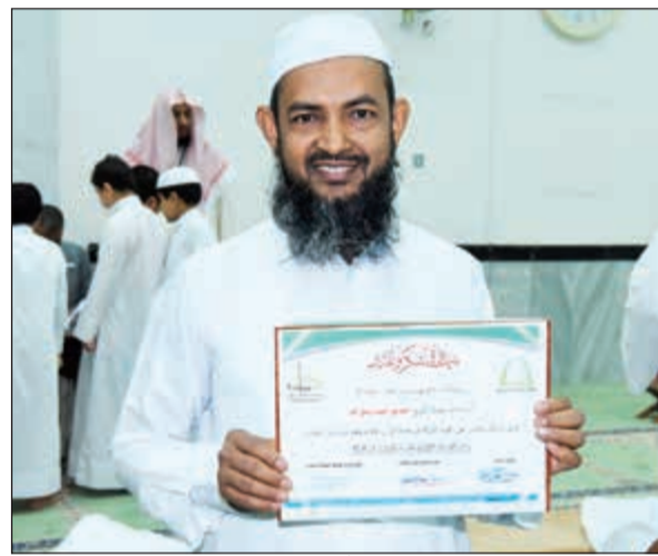
الشيخ صديق مفلح حلقة الجاليات الآسيوية