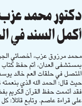
حسن وائل الجوهري