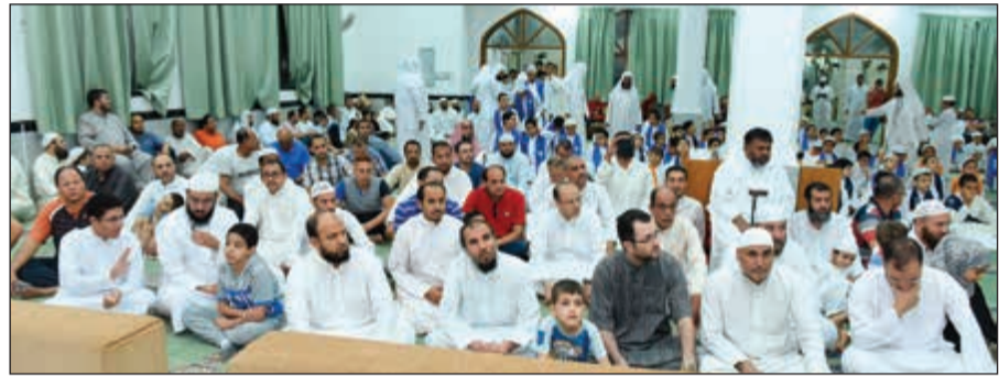
جانب من الحضور الحاشد في الحفل السنوي