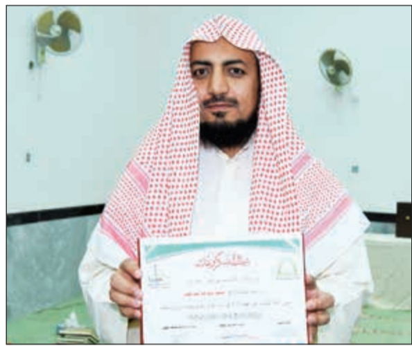
الشيخ محمد فتح الله