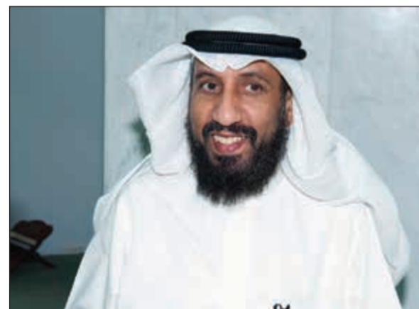
الشيخ خالد الخراز