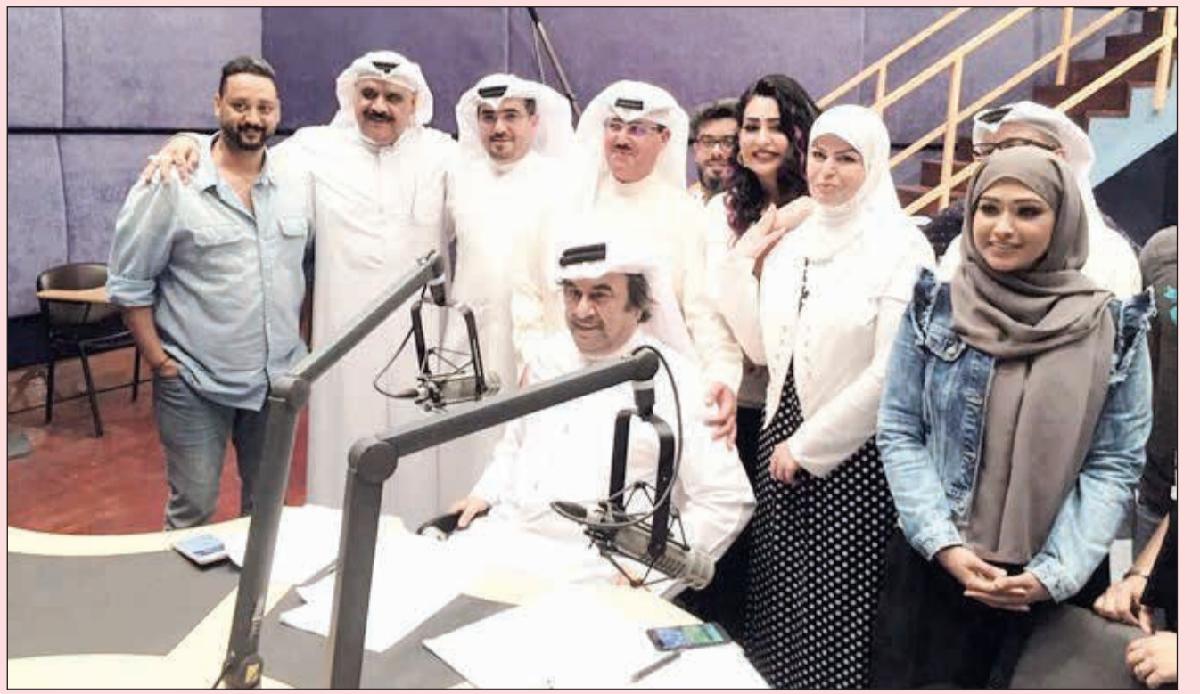
وكيل الإذاعة الشيخ فهد المبارك والفنان القدير عبدالحسين عبدالرضا يتوسطان فريق مسلسل «مول الهوايل»

وأشفت لوسي أيضا أن وشقت تشاك بها في هناك شخصية سياسية كبيرة رفضت ذكر اسمها طلبت منها الزواج ولم يكن يعرف أنها متروجة.