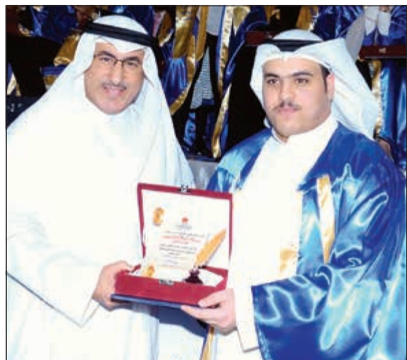
الفارس مكرما احد المتفوقين