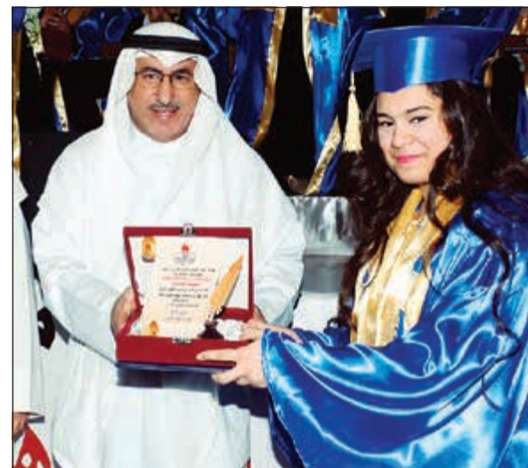
الوزير الفارس يكرم إحدى متفوقات الثانوية العامة