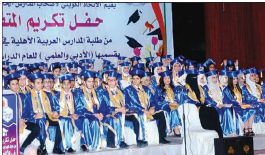
صورة جماعية للمتفوقين الثانوية العامة