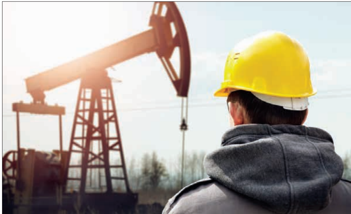
عدم توافر شواغر في القطاع النفطي يحول دون تعيين نحو 1800 كويتي

وفي السياق نفسه، فإنه وعقب انخفاضات أسعار النفط منذ العام 2014 لجأت مؤسسة البترول الكويتية إلى تطبيق سياسة إحلال العمالة الوطنية محل العمالة الوافدة وذلك في الحدود والكيفية التي تضعها مؤسسة البترول