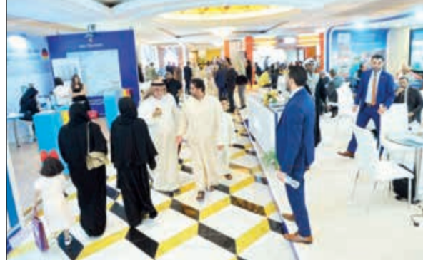
صورة لأحد معارض الشركة السابقة

وعن مفاجأة الشركة خلال المعرض وهي مكاتب تجارية برعاية بنك دبي الوطني في قلب شارع الشيخ زايد بأسعار 8000 دينار كويتي وعوائد إيجارية لمدة 5 سنوات.