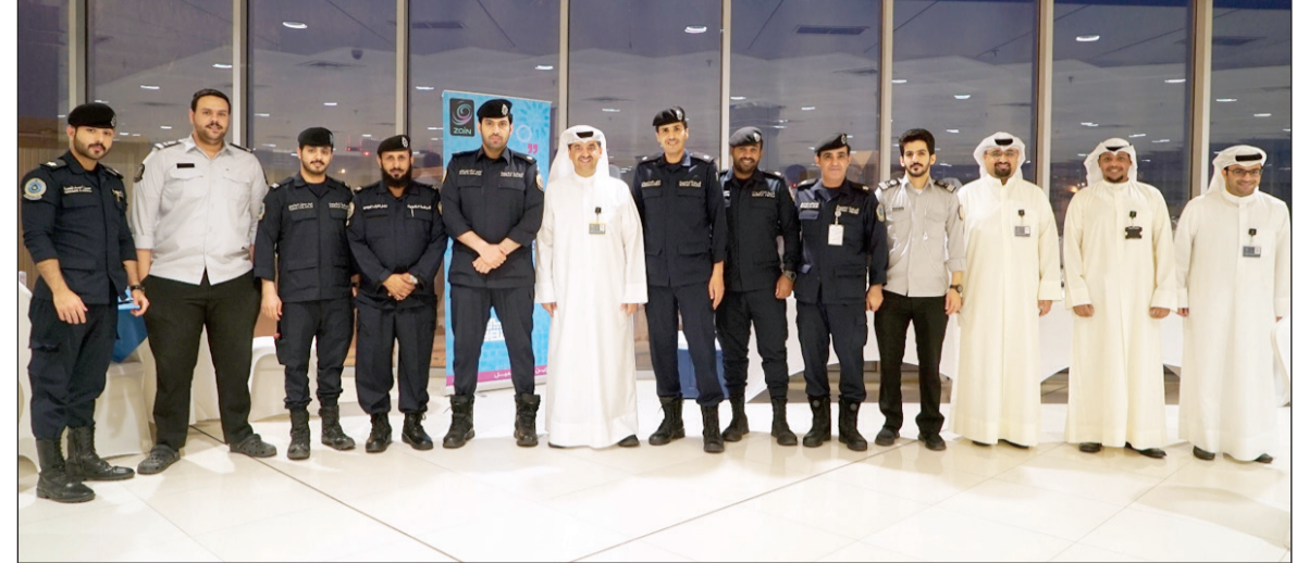
مسؤولو «زين» مع أفراد أمن المطار

شهر رمضان المبارك، وذلك باعتبارها من المؤسسات الاقتصادية الرائدة التي تؤمن أن لديها رسالة والتزامات حقيقية تجاه المجتمع. وأقادت «زين» بأن التزامها المستمر في تقديم قيمة مضافة للمجتمع، هو ما يجعلها تحرص على تناول القضايا الأكثر تأثيراً في الحياة، مبيّنة أن حملتها الرمضانية «زين الشهر» تأتي لترجم هذا التوجه، حيث تحصل معها رسالة تحت على التقارب والتراحم والمشاركة في الحياة والسلام في العالم.