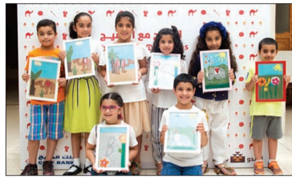
الأطفال... ولوحات جميلة

استكشاف ما يضمنه متحف جمعية السدو الحرفية من قطع فنية تراثية. وخلال ورش العمل، يتم إرشاد الأطفال أثناء اختيارهم للألوان والتصميمات وكذلك الأساليب الفنية المستخدمة، وذلك بهدف تنمية مهارات الابتكار لديهم مع الحفاظ على روح البهجة والاستمتاع