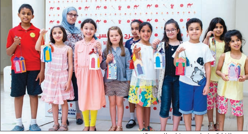
عدد من المشاركين في إحدى ورشات «المرح مع النسيج»

أعلن بنك الخليج وجمعية السدو الحرفية عن اختتام المرحلة الأولى من سلسلة ورش العمل التثقيفية للأطفال بعنوان «المرح مع النسيج» والتي تقام على مدار عام كامل ونحث على الاستمتاع بالأشغال اليدوية، بهدف تنمية مهارات الأطفال وتعزيز قدراتهم في صناعة المشغولات وفنون الرسم على الأنسجة، ويتم استئناف الأنشطة في شهر سبتمبر، بعد العطلة الصيفية، وتستمر حتى نهاية العام.