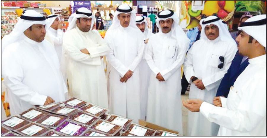
خالد الروضان والنائب الحميدي السبيعي خلال جولة في تعاونية الفحيجيل

التفتيش منتشرة وموجودة وفي كل الأوقات خلال شهر رمضان المبارك وإن أي محاولة للغش التجاري أو التلاعب في الأسعار ستكون تلك الفرق لها بالمرصاد وستحال أي شركة متورطة إلى النيابة التجارية. وأضاف أن الجولات التفتيشية للمفتشين على الجمعيات والأسواق المركزية ستكون بصفة مستمرة للوقوف على أسعار السلع وعلى مدى التزام الشركات بها وستظل العين المتابعة للمواطن والمقيم ضد أي محاولة استغلال. من جانبه، شكر النائب الحميدي السبيعي الوزير خالد الروضان على جولته الرمضانية، لافتاً إلى أن البعض يحاول استغلال الشهر الفضيل بزيادة الأسعار والتكلفة على المستهلك، مضيفاً أن الأسعار منطوية جداً خصوصاً في مثل هذا الوقت، ونتمنى أن تستمر الوزارة على مدار السنة في متابعة أسعار السلع، وقد وعدنا الوزير الروضان بأنه لن يسمح بأي زيادة واستغلال للمستهلك.