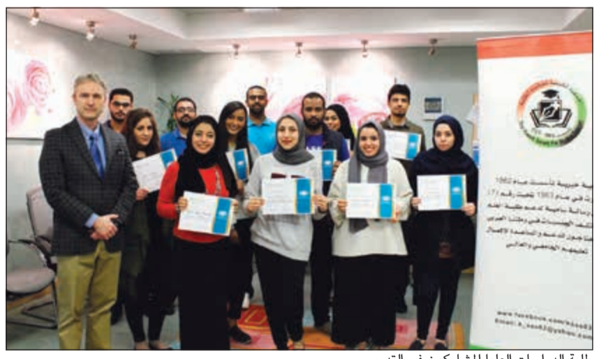
طلبة الدراسات العليا المشاركون في التدريب

مجال التعليم المستمر ليس لوظيفتها فقط بل لجمع العاملين في المجتمع الطبي المحلي. وأقادت بان من أهداف المؤسسة، كونها منظمة غير ربحية متخصصة في الرعاية الصحية، تمكن الأطباء في الكويت من الاستفادة من المعرفة والعلم وتشجيعهم على الممارسة المتخصصة القائمة على الأدلة إلى جانب تطوير قطاع الرعاية الصحية في البلاد.