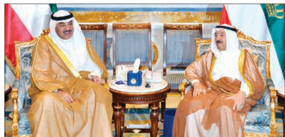
صاحب السمو الأمير مستقبلاً الشيخ صباح الخالد

استقبل صاحب السمو الأمير الشيخ صباح الأحمد بقصر بيان صباح امس سمو ولي العهد الشيخ نواف الأحمد. كما استقبل سموه بقصر بيان صباح امس رئيس مجلس الأمة مزروق الغانم. واستقبل سموه سمو رئيس مجلس الوزراء الشيخ جابر المبارك. كما استقبل سموه بقصر بيان صباح امس النائب الأول لرئيس مجلس الوزراء ووزير الخارجية الشيخ صباح الخالد.