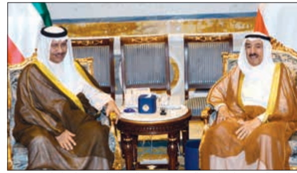
صاحب السمو خلال استقباله سمو رئيس الوزراء الشيخ جابر المبارك