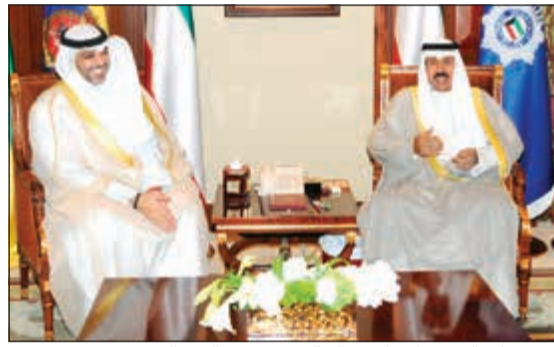
سمو ولي العهد خلال استقباله الشيخ محمد العبد الله