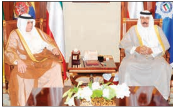
سمو ولي العهد الشيخ نواف الأحمد مستقبلاً الشيخ خالد الجراح

الداخلية الشيخ خالد الجراح. كما استقبل سمو ولي العهد وزير الدولة لشؤون مجلس الوزراء ووزير الإعلام بالوكالة الشيخ محمد العبدالله.