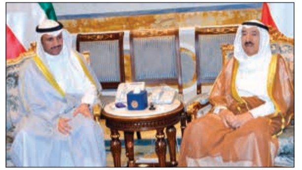
صاحب السمو الأمير الشيخ صباح الاحمد مستقبلاً مزروق الغانم