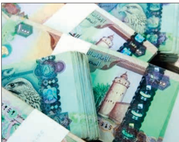
جرى ضبطهما لاحقا، وشمل الإغراق إلى جانب السيولة

مميّزة، ورحلات سفر إلى دول أوروبية على درجات رجال الأعمال، وشراء هدايا باهظة الثمن، وساعات تميّنة من ماركات عالمية. واعترفت المشتبه فيها بالجريمة، أثناء الاستجواب، وأقادت بانها لم ترغب في أن تكون مقصورة ماليا لمن أحبها وقطع وعدا بالارتباط بها، لاسيما إظهارها بأن لديها أموالا طائلة، كما اعترف الشاب وشقيقه بتورطهما بالواقعة والتغريب بالفتاة واستغلالها، فجرى إحالتهم جميعا إلى النيابة العامة لاستكمال الإجراءات القانونية بحقهم. دفع ديونهما، وشراء سيارات فارته وأرقام لوحات