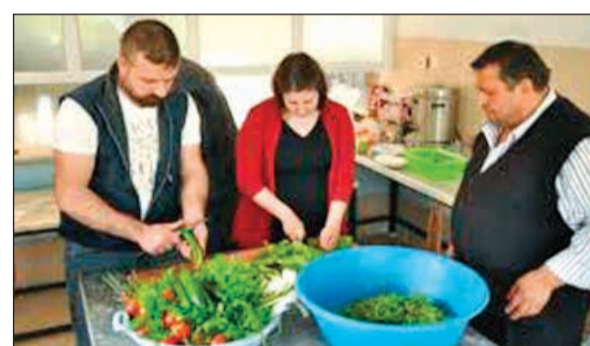
إحدى الأسر تعد الإفطار

بمساعدة الجيران». وعن العلاقات الاجتماعية بين الأهالي، قال المختار: «بفضل هذه العادة ليس هناك فتور وشقاق وخصومة بين سكان القرية، ولا نعاني من أي مشكلة، كلنا نجلس معا ونقضي وقتنا بشكل جماعي». وأعرب ضويغو المكونة من 30 منزلا، على تناول إفطار على مائدة واحدة بمركز الخدمات الاجتماعية التابع لمسجد القرية منذ 15 عاما. وفي حديثه للأناضول، قال مختار القرية رجب ضويغو: كل يوم تتكفل إحدى الأسر بطهي المأكولات وإعداد الأطباق،