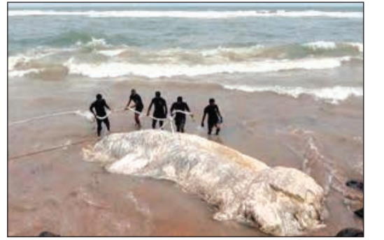
عملية إنقاذ أحد الحيتان الجانحة

كولومبو - رويترز: أعلنت البحرية السريلانكية أنها أعادت 20 حوتاً جانحاً قبالة شاطئ بلدة سامبور بشرق سريلانكا إلى البحر بمساعدة السكان المحليين. وقال مسؤولون، إنهم لا يعرفون سبب خروج الحيتان قرب الشاطئ بالقرب من تريكووالي. لكن المتحدث باسم البحرية، تشامبيندا والاكولوج، قال: «قد يكون ذلك بسبب تغير تيار البحر أو زيادة درجة حرارة سطح البحر».