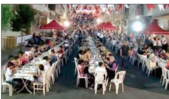
سكان القرية يتناولون الإفطار معا