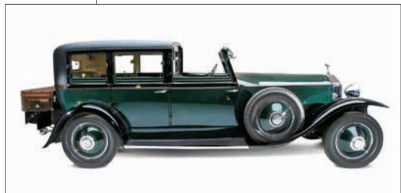
فانتوم الجيل الأول بنسخة فريد أستير

في دارها الجديد في جودود، غرب ساسكس. كانت سيارة عصرية جدا وإنما مع الحفاظ على المسمات الجمالية الأساسية التي تميز طرازات فانتوم. تم بناء تلك السيارة في دار رولز-رويس، في مركز التميز القم في الحداثة، وتم تجهيزها بمحرك سعة 6,75 ليترات يضم 12 أسطوانة وينتج قوة تبلغ 453 حصاناً، أي ما يمكنها من التسارع من صفر إلى 62 ميلاً بالساعة في غضون 5,9 ثوان، كما وفرت جميع وسائل الراحة التي قد يطمح إليها أي عميل عصري. ومع العناية الدقيقة بأصغر التفاصيل، والتي تنعكس على سبيل المثال في ميزات السيارة المسوسة بمادة التفلون، ومراكز العجلات ذاتية التوجيه، لم يعد من مجال للشك بأن العلامة في أياد أمينة، وتوقف إنتاج فانتوم الجيل السابع بعد 13 عاماً أي نهاية عام 2016.