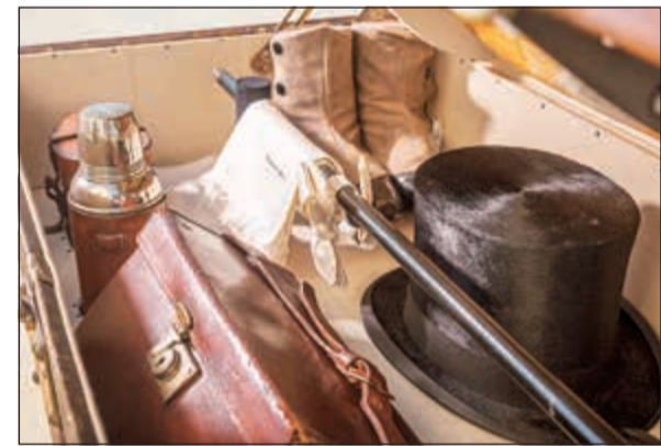
بعض المنتجات الخاصة بسيارة الجيل الأول