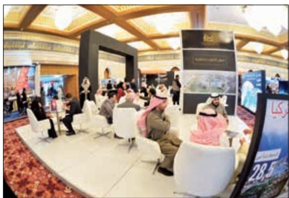
جانب من معارض «إكسبو سيتي» السابقة

باقعة من التسهيلات في الدفع. وعن مشروع «بهشة» وتابعت: «يوفر «المنار المكي» Hilton، قالت رمزي أنه أضخم مشروع سكني في إسطنبول وهو جاهز للتسليم ومتكامل الخدمات وبضمان من الحكومة التركية مع تسهيلات السداد لـ 10 سنوات، لافتة إلى أنه يقع في منطقة بهشة شهير وهي واحدة من المناطق الأوسع نمواً في إسطنبول، حيث يمتد على مساحة 119 ألف متراً مربعاً ويتميز المشروع بأنه محاط بالطبيعة الخلابة، كما أن جميع الشقق في هذا المشروع تتميز بالمناظر الطبيعية وتضمن العديد من الخصائص مثل حمام السباحة المكشوف والحديقة ذات التصميم المميز ومواقف سيارات لكل شقة وأماكن ألعاب للأطفال ومرات لمشاة ونظام تدفئة مركزي وإضاءة في الطريق مع نظام حماية ومراقبة على مدار 24 ساعة.