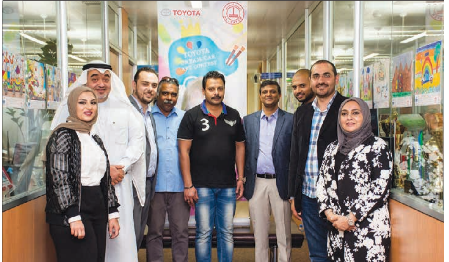
لجنة التحكيم في مسابقة تويوتا الحادية عشرة مع فريق عمل «الساير»