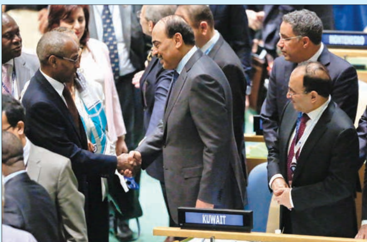
الشيخ صباح الخالد يتلقى التهاني عقب فوز الكويت بعضوية مجلس الأمن ويبدو السفير منصور العتيبي

أحدث الفوز المتوقع للكويت بمقعد غير دائم في مجلس الأمن للمعلمين المقبلين 2018 و2019 صدى واسعاً وترحباً كبيراً بالنظر إلى شبه الإجماع في التصويت المؤيد بـ 188 صوتاً. صاحب السمو الأمير الشيخ صباح الأحمد أكد في برقية تهنئة إلى النائب الأول لرئيس الوزراء ووزير الخارجية الشيخ صباح الخالد أن هذا الفوز يشكل نجاحاً للديبلوماسية الكويتية وتعزيزاً للمكانة المرموقة التي تحظى بها الكويت على الصعيد الدولي. خليجياً، أعلنت الإمارات والبحرين وقطر أن هذا الإنجاز من شأنه أن يدفع جهود الإمة والاستقرار في المنطقة ودعم التوصل إلى حلول عادلة وشاملة لقضايا الأمتين العربية والإسلامية ومواجهة التحديات التي تهدد المجتمع الدولي. وكشفت فرنسا عبر بيان رسمي لوزارة الخارجية أن باريس تتطلع إلى العمل مع الأعضاء غير الدائمين الجدد في مجلس الأمن وهم الكويت وكوت ديفوار وغينيا الاستوائية وبيرو وبولندا حول كل الموضوعات ذات الصلة في مجلس الأمن الذي يلعب دوراً أساسياً في الحفاظ على الأمن والسلام الدوليين. وكان الشيخ صباح الخالد قد تمنى الاستمرار في النهج والمنهج، الذي من خلاله كسبت الكويت احترام وثقة العالم. وأضاف: الكويت ستعمل مع الدول الأعضاء لمنع نشوب الحروب والسعي لحلها بالطرق السلمية، مشيراً إلى تسريع الإجراءات لمواجهة الأحداث حتى لا تتفاقم وتصبح أكثر تعقيداً. مبدئياً أهمية العمل من داخل المجلس على إصلاح الامم المتحدة حتى تكون المنطقة مواكبة للأحداث المحيطة في العالم وأهمها تعزيز الأمن والسلام الدوليين.