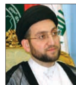
السيد عمار الحكيم

يصل إلى البلاد اليوم الأحد رئيس التحالف الوطني ورئيس المجلس الإسلامي الأعلى في العراق السيد عمار الحكيم في زيارة رمضانية متعادية، حيث يلتقي كبار المسؤولين، كما سيعد مؤتمر صحافياً غداً الإثنين يستعرض فيه آخر التطورات على الساحتين العراقية والإقليمية.