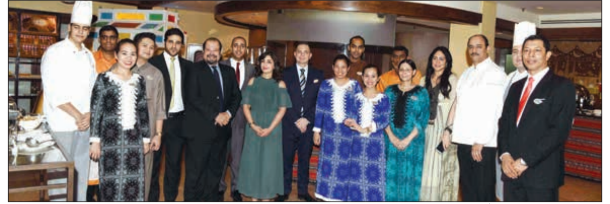
لقطة تذكارية خلال غبقة «موقنبيك البدع»

أقام فندق ومنتجع موقنبيك البدع الغبقة الرمضانية السنوية، وقد حضر مجموعة كبيرة من الإعلاميين والصحافيين البارزين ونخبة من المدونين في الكويت بالمطعم الرئيسي للفندق «بريز».