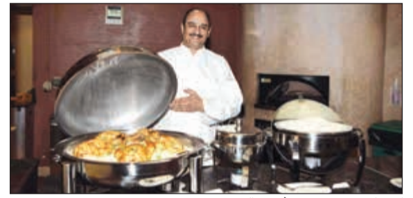
كل ما تشتهي في «موقنبيك البدع»