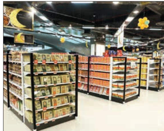
كل ما تحتاجه الأسرة تحت سقف واحد

ومع خبرة تزيد على 35 عاما في قطاع تجارة التجزئة، يواصل مركز سلطان تمهيد الطريق أمام العملاء للاستمتاع بتجربة تسوق فريدة من نوعها، فقد تم تجهيز فرع مركز سلطان الجديد ليوفر مجموعة واسعة من السلع الاستهلاكية للبقالة والخضراوات الطازجة المحلية والمستوردة على حد سواء، بالإضافة إلى محطات كاملة تضم تشكيلات وفيرة من ثمار البحر والأسماك واللحوم بمختلف أشكالها وأنواعها، ومحطات أخرى مخصصة للمأكولات الباردة والأجبان واللحوم الباردة والسلطات ومجموعة متنوعة من المخبزات الجاهزة للتقديم، كما يشتمل الفرع أيضا على بار للسوشي وقسم للمأكولات الساخنة التي يمكن للعميل تناولها داخل الفرع أو أخذها مغلفة لتناولها في المكان الذي يرغب فيه. ولحبي المخبوزات الطازجة