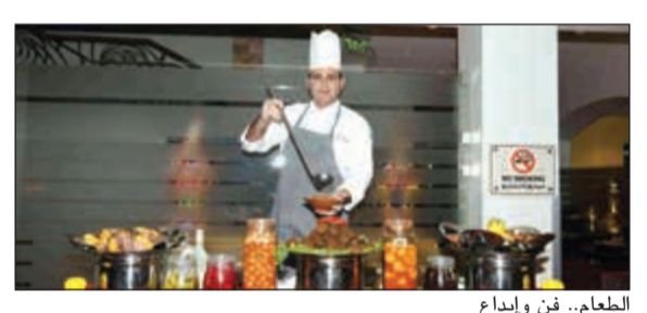
الطعام... فن وإبداع