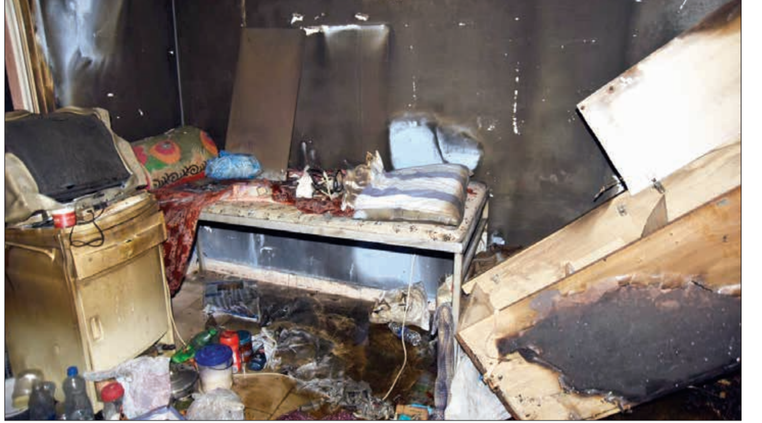
آثار حريق شقة خيطان