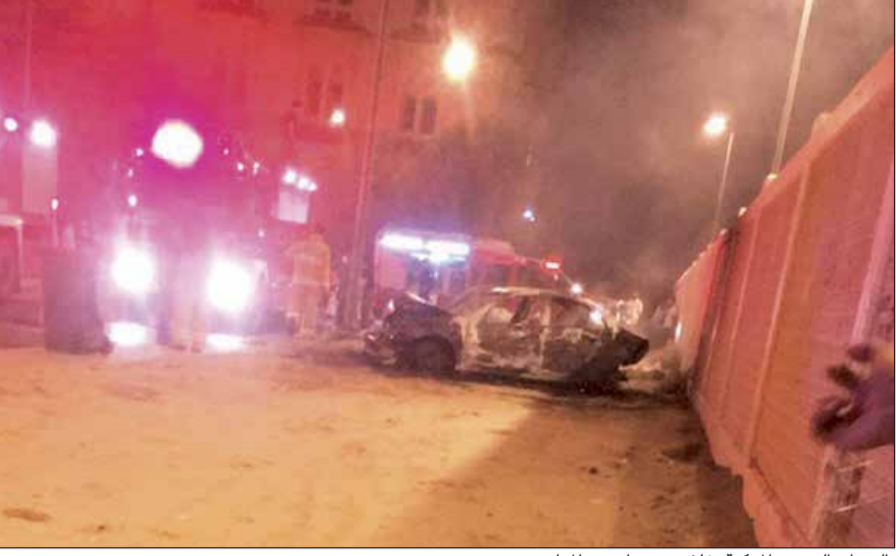
النيران التهمت المركبة خلف سور إحدى المدارس