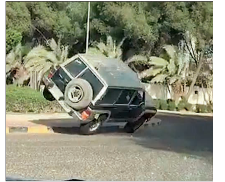
رباعية على تايرين غرب مشرف