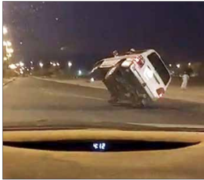
وفي منطقة سعد العبدالله