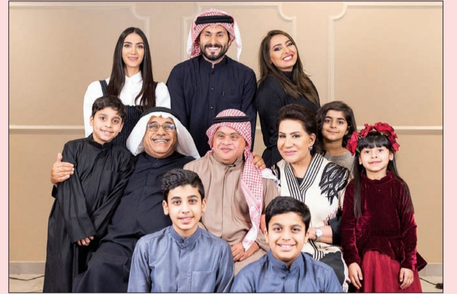
الفنانة القديرة سعاد عبدالله في «كان في كل زمان»

● لا غير وارد، فالحلقات التلفزيونية تعطيني مجالاً أكثر اتساعاً لما أريد التعبير عنه، رغم أنني أشاهد كثيراً الأفلام العربية والعالمية، وأي فيلم مميز أو تشار عليه ضجة لا بد أن أتابعه، وكذلك أتابع المسلسلات الإنجليزية والأميركية بشغف، بمجرد انتهائي من التصوير أبدأ المشاهدات.