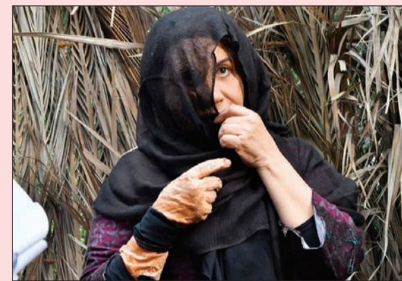
أم طلال في إحدى شخصيات «كان في كل زمان»

المسلسل أشعر بالافراج والراحة بعد التعب، فاعتقد أن غسدا عيد التصوير والتعب علي بالنسبة لي.