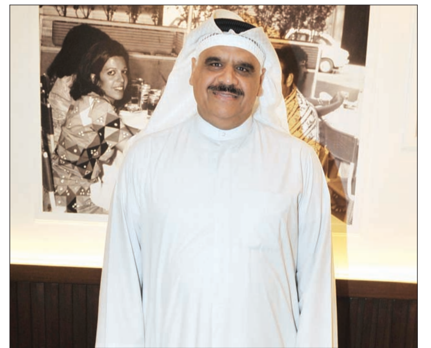
النجم داود حسين

قبل مغادرته المستشفى. بو حسين من خلال «الأنباء» شكر جميع من سأل عنه سواء بالاتصال أو الحضور للمستشفى، متمنياً لهم الصحة والعافية. الحمد لله على سلامتكم بو حسين وخطاك السوء.