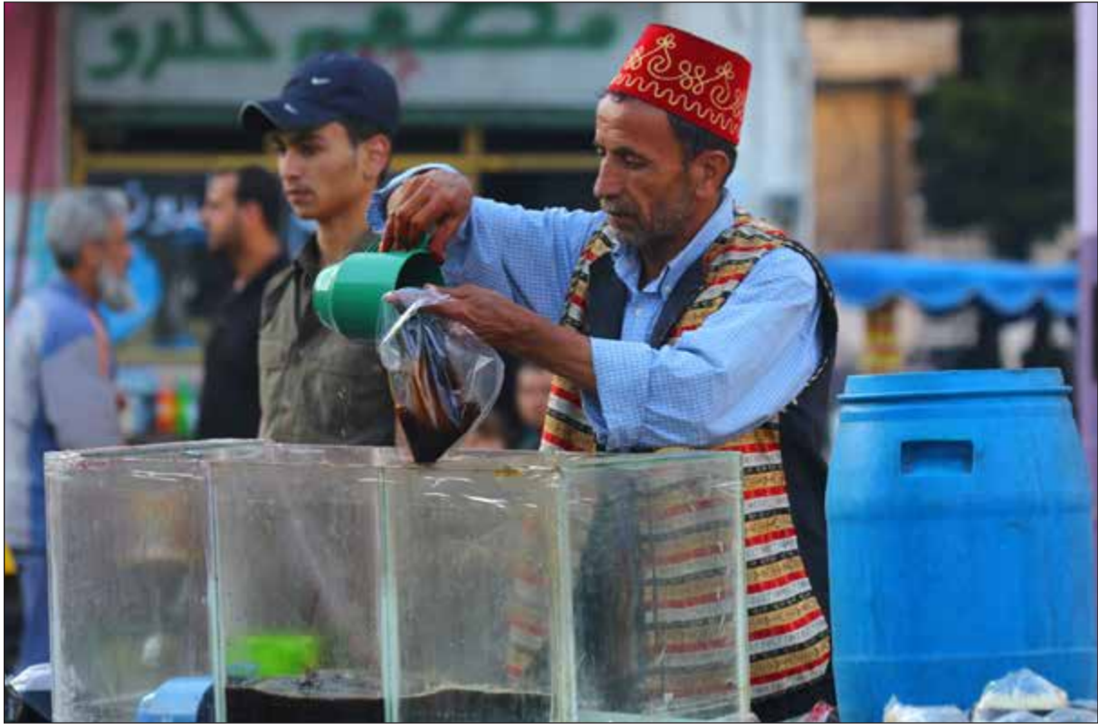
بائع العرق سوس قبيل الإفطار في أحد أسواق حلب

عواصم - وكالات: دخل صراع القوى الدولية والإقليمية على الكعكة السورية، بعدا جديدا مع اختراق ميليشيات الحشد الشعبي الحدود السورية وسيطرتها على مواقع في محافظة الحسكة.