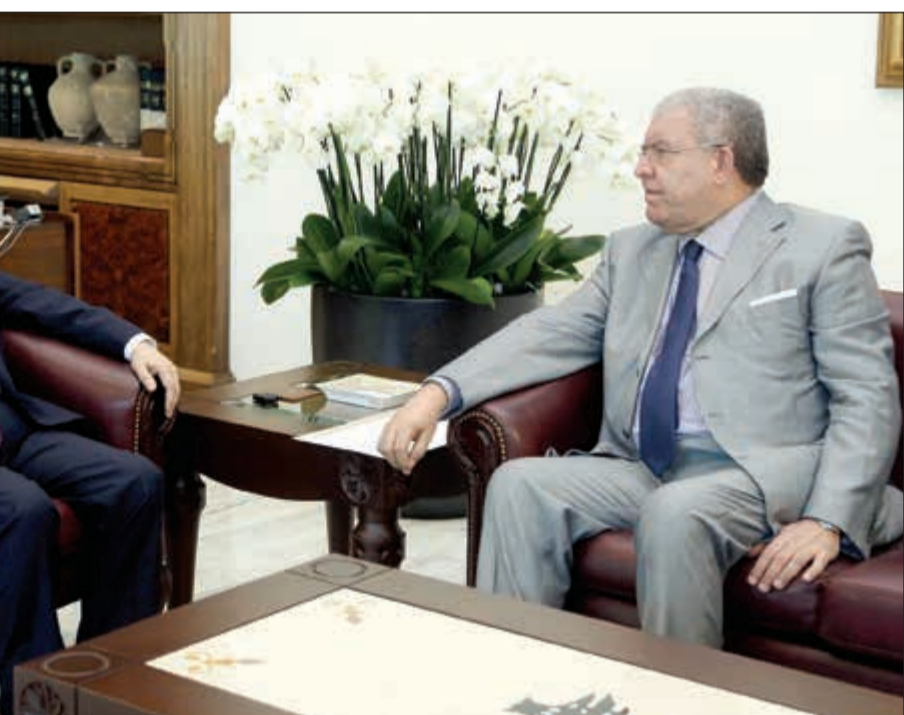
رئيس الجمهورية العماد ميشال عون مستقبلا وزير الداخلية نهاد المشنوق في بعيدا

رئيس حزب الكتائب النائب سامي الجميل عقب على الدعوى التي أقامها عليه وعلى 400 مواطن آخرين مقرر وزارة الأفرجة الأخير الذي عقد في ممثلي الأطراف فكرة «تأهيل اللوائح الانتخابية»، على أن يشترط بكل لائحة الحصول على 10٪ من أصوات الدائرة، كي يحق لها الاشتراك في انتخابات المرحلة الثانية. هذا الطرح، الذي وصفه البعض بالعقدة الجديدة أتاح الاعتقاد مجددا، بأن نمته من لا يريد لهذه الانتخابات أن تحصل، أو على الأقل لا يريد بها غير قانون الستين الساري المفعول، فمادما يحصل إذا ما اعتمدت فكرة تأهيل اللوائح في دائرة يترشح فيها أربعة لوائح، إذا