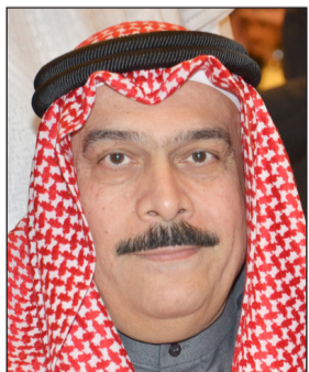
المستشار نصر آل هيد

الحكم نهائيا بكفالة مالية بـ 1000 دينار وإحالة الدعوى المدنية إلى المحكمة المختصة، أُنكرت المتهمة أمام محكمة الاستئناف الاتهام الموجه إليها فيما أكد محامها أن الإصابات الواردة في تقرير الطبيب الشرعي لم يجزم بنسبة إصابة المجني عليها والمجني عليها لم تذكر أن المتهمة ضربتها بجسم صلب في الاعتداء عليها. وقالت «الاستئناف» في حثيات حكمها «إن الواقعة تتلخص في قيام المتهمة وبعد مشادة مع المجني عليها قامت الأولى بإمسك يد الثانية ولها خلفها ودفعتها إلى الحائط»، مؤكدة أن التقارير الطبية خلصت إلى إصابة المجني عليها بإصابات متفرقة عبارة عن رض في أصابع ويد اليمنى قضت محكمة الاستئناف برئاسة المستشار نصر سالم آل هيد وعضوية المستشارين سرور برغل ومحمد شتا بتأييد حبس متهمة سنتين مع الشغل مع وقف تنفيذ العقوبة لمدة ثلاث سنوات تبدأ من صيرورة الحكم نهائيا بكفالة مالية بـ 1000 دينار وإحالة الدعوى المدنية إلى المحكمة المختصة. واتهمت النيابة العامة المتهمة بأنها أحدثت عدا بالمجني عليها وهي موظفة في إدارة حكومية الإصابات الموصوفة بتقرير الطبيب الشرعي. وفيما قضت محكمة الجنائيات بحبس المتهمة سنتين مع الشغل مع وقف تنفيذ العقوبة لمدة ثلاث سنوات تبدأ من صيرورة