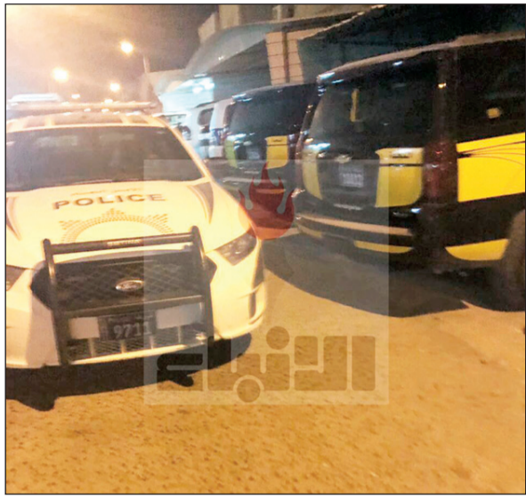
تظهر دوريات الأمن في موقع الجريمة

وملابسه ملوثة فقال له من باب الاستعطف انه سيسلم نفسه وطلب من الابن الا يبلغ لان اخاه لم يكن سلوكه طيبا. واراد المصير بالقول: بعد التأكد من ان الاب هو القاتل تم الاستماع الى اقواله ومواجهته بأدلة عليه وامام هذه الأدلة والتحريرات، أقر الاب بأنه قتل ابنه للتخلص من مشاكله الكثيرة، مشيرا الى ان ابنه تسبب له في مشكلات كثيرة، وأنه قرر ان يتخلص منه فاستغل خروج عدد من افراد أسرته ودخل على ابنه حيث كان نائما وقتله ومن ثم نظف الغرفة بشكل جيد ونظف ملابسه وترك ابنه ليبلغ عن الجريمة.