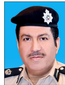
اللواء محمد العنزي

انه خليجي وبالتحقيق معه اعترف بأنه الخطا وان الفتاة التي برفقته يعرفها وأرشد عنها ليتم ضبطها وأقرت بأنها كانت تمزح، وان صديقها العسكري هو من أعطاها المستندات ولم تكن تتوقع ان تصل الأمور الى حد ان تحظى قضيتها بهذا الاهتمام. هذا واخضع اللواء العنزي العسكري الخليجي للتحقيق وجار اتخاذ اجراء عقابي حاسم مناسب ما عا ارتكبه. يشار الى ان الشرطي من مرتبات مرور حولي.