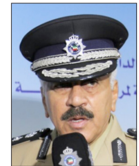
الفريق محمود الدوسري

انه خليجي وبالتحقيق معه اعترف بأنه الخطا وان الفتاة التي برفقته يعرفها وأرشد عنها ليتم ضبطها وأقرت بأنها كانت تمزح، وان صديقها العسكري هو من أعطاها المستندات ولم تكن تتوقع ان تصل الأمور الى حد ان تحظى قضيتها بهذا الاهتمام. هذا واخضع اللواء العنزي العسكري الخليجي للتحقيق وجار اتخاذ اجراء عقابي حاسم مناسب ما عا ارتكبه. يشار الى ان الشرطي من مرتبات مرور حولي.