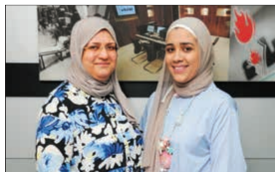
هبة حياتي برفقة والدتها

التوتر الذي يرافق كافة امتحاناتها وأن امتحانات العام الحالي سهلة وتناسب