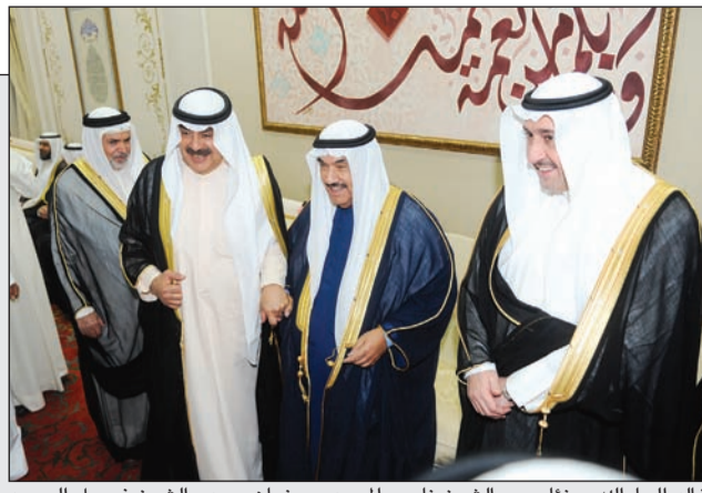
خالد الجارالله مهنتا سمو الشيخ ناصر المحمد برمضان ويبدو الشيخ فيصل الحمود والسفير البحريني الشيخ خليفة بن حمد

الجارالله على هامش استقبال ناصر المحمد المهنيين برمضان: العلاقات الخليجية قادرة على استيعاب أي توترات 09 08