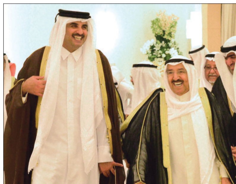
صاحب السمو الأمير الشيخ صباح الأحمد وصاحب السمو الشيخ تميم بن حمد خلال مأدبة الإفطار التي اقامها صاحب السمو أمس الأول على شرف أمير قطر

مريم بنق كشفت مصادر قانونية رفيعة في تصريحات خاصة لـ «الأنباء» عن دستورية موافقة اللجنة التشريعية البرلمانية على منح المرأة الكويتية الوظيفة والمتزوجة العلاوة الاجتماعية للأبناء في حال عدم تقاضي الزوج تلك العلاوة. وأعربت المصادر عن أهمية مبادرة حكومية تتمثل في إصدار قرار بمنح المرأة الكويتية الوظيفة، والمتزوجة العلاوة