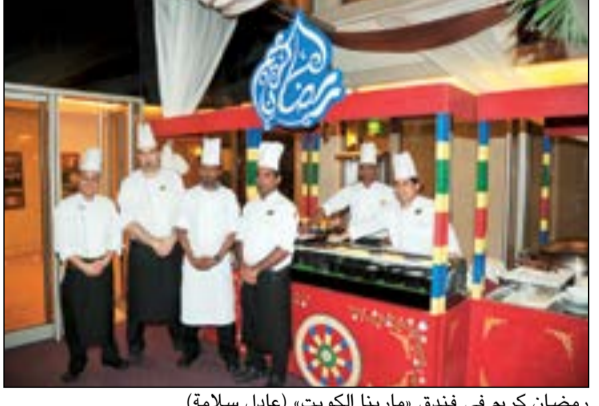
رمضان كريم في فندق «مارينا الكويت»

وبالنسبة للمجموعات الكبيرة من الأفراد الراغبين بتجربة إفطار فريدة، وكذلك للفرق الخاصة ولائم الشركات بعد «مسرح وصالة سلوى صباح الأحمد» المكان المثالي لهذه الفعاليات، مع اهتمام خاص وخدمات لا مثيل لها، وقدرة استيعابية لـ 500 ضيف في نفس الوقت، كما يوفر تشكيلة متنوعة من المأكولات لوجبتي الإفطار والسحور بأسعار حصرية.