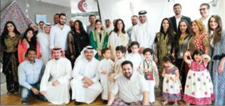
لقطة جماعية مع موظفي قطاع التسويق

احتفلت Ooredoo، أسرع شبكة في الكويت، بمائدة «القريش» الأسبوع الماضي، حيث ضمت جميع موظفيها في مقرها الرئيسي بشارع السور استقبالا لشهر رمضان المبارك. وتحرص الشركة على تنظيم مأدبة القريش الرمضانية سنويا إحياء للتراث الشعبي والتقاليد الكويتية الأصيلة. وشارك جميع الموظفين في هذه المناسبة لتبادل التهنئة بحلول الشهر الفضيل، حيث نظم كل قسم مأدبة خاصة وسط أجواء احتفالية يطالع تراثي. وتستمر Ooredoo في سعيها نحو تعزيز روح الفريق الواحد والأجواء العائلية من خلال العديد من الفعاليات التي تقوم بتنظيمها بشكل دوري في مختلف المناسبات، خصوصا التي تسهم في إحياء التراث والعادات والتقاليد الكويتية الأصيلة، ويأتي ذلك ليعزز القيم الأساسية في الشركة المبنيّة على الاهتمام والتواصل، والتي تلعب دورا كبيرا ضمن سياسة الشركة للاتصال الداخلي الرامية نحو تعزيز بيئة العمل وتقوية أواصر الترابط بين الموظفين.