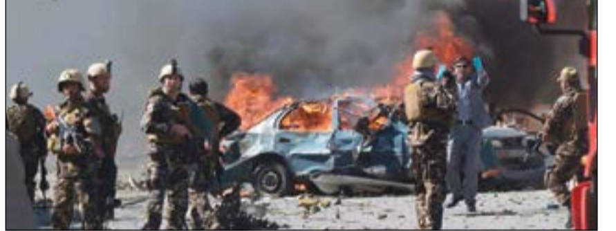
قوات الأمن الأفغانية في موقع التفجير في كابل اس (أ.ف.ب)

عواصم - وكالات: قتل ما لا يقل عن 80 شخصاً وأصيب المئات اس في انفجار بشاحنة مفخخة وقع في الحي الدبلوماسي في كابل متسبباً بمجزرة تبناها «داعش» في العاصمة الأفغانية وبأضرار مادية غير معتمدة أدت إلى تحطيم التوافد وتطابق الأبواب في منازل على بعد مئات الأمتار. وقالت الشرطة إن قنبلة ضخمة مخبأة في صهريج لنقل مياه الصرف الصحي انفجرت في ساعة الذروة الصباحية بوسط كابل ما أسقط المئات بين عواصم - وكالات: قتل ما لا يقل عن 80 شخصاً وأصيب المئات اس في انفجار بشاحنة مفخخة وقع في الحي الدبلوماسي في كابل متسبباً بمجزرة تبناها «داعش» في العاصمة الأفغانية وبأضرار مادية غير معتمدة أدت إلى تحطيم التوافد وتطابق الأبواب في منازل على بعد مئات الأمتار. وقالت الشرطة إن قنبلة ضخمة مخبأة في صهريج لنقل مياه الصرف الصحي انفجرت في ساعة الذروة الصباحية بوسط كابل ما أسقط المئات بين