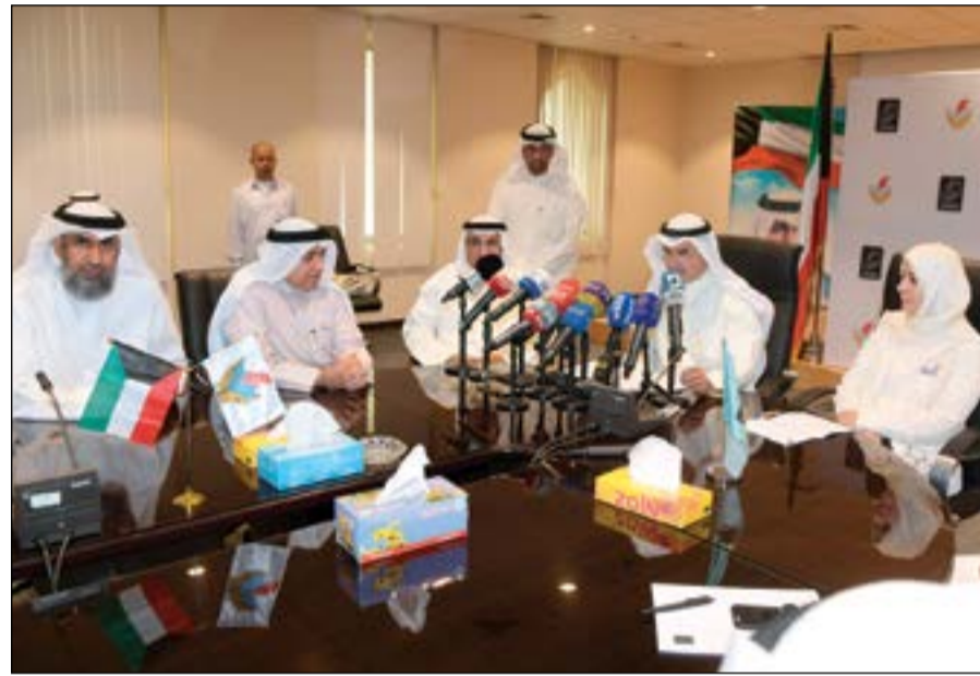
الوزير عصام المرزوق وم. أحمد الجسار والرئيس التنفيذي لـ «زين» إيمان الروضان وم. محمد بوشهري ود. مشعان العتيبي خلال حفل توقيع أول عقود العدادات الذكية بين وزارة الكهرباء وشركة زين

نرج ناصر كشف مصدر مسؤول بوزارة الأشغال أن مجمع الوزارات بالجھراء المزمع تنفيذه سيتم إلغاؤه نهائياً وذلك بسبب رفض وزارة المالية توفير الميزانية المخصصة له والبالغة 303 ملايين دينار. وكشف المصدر أن الوزارة قد درست