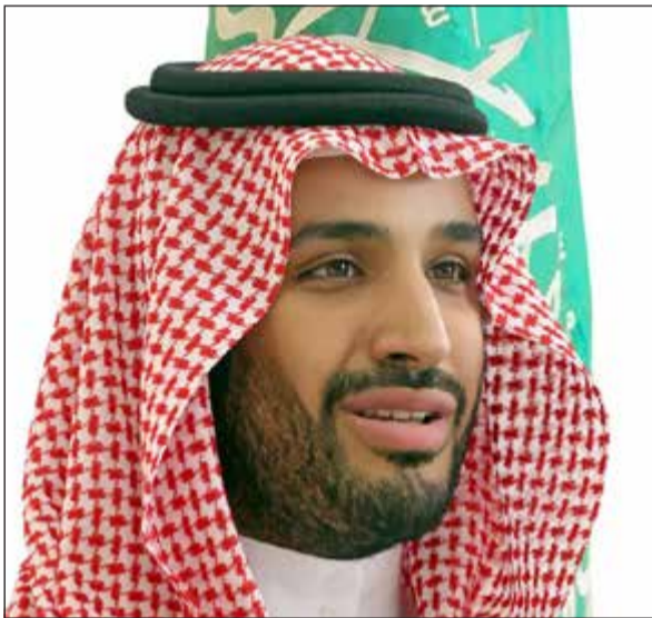
صاحب السمو الملكي الأمير محمد بن سلمان ولي ولي العهد النائب الثاني لرئيس مجلس الوزراء وزير الدفاع السعودي

العربية.نت: يجري صاحب السمو الملكي الأمير محمد بن سلمان، ولي ولي العهد النائب الثاني لرئيس مجلس الوزراء وزير الدفاع السعودي، مباحثات مع الرئيس الروسي، فلاديمير بوتين، خلال زيارة رسمية لموسكو اليوم. وستتناول المباحثات ملفات التعاون الثنائي بين البلدين، كما سيتم توقيع نحو 4 بروتوكولات تعاون بين موسكو والرياض، كذلك ستتم مناقشة ملفي سورية وايران.