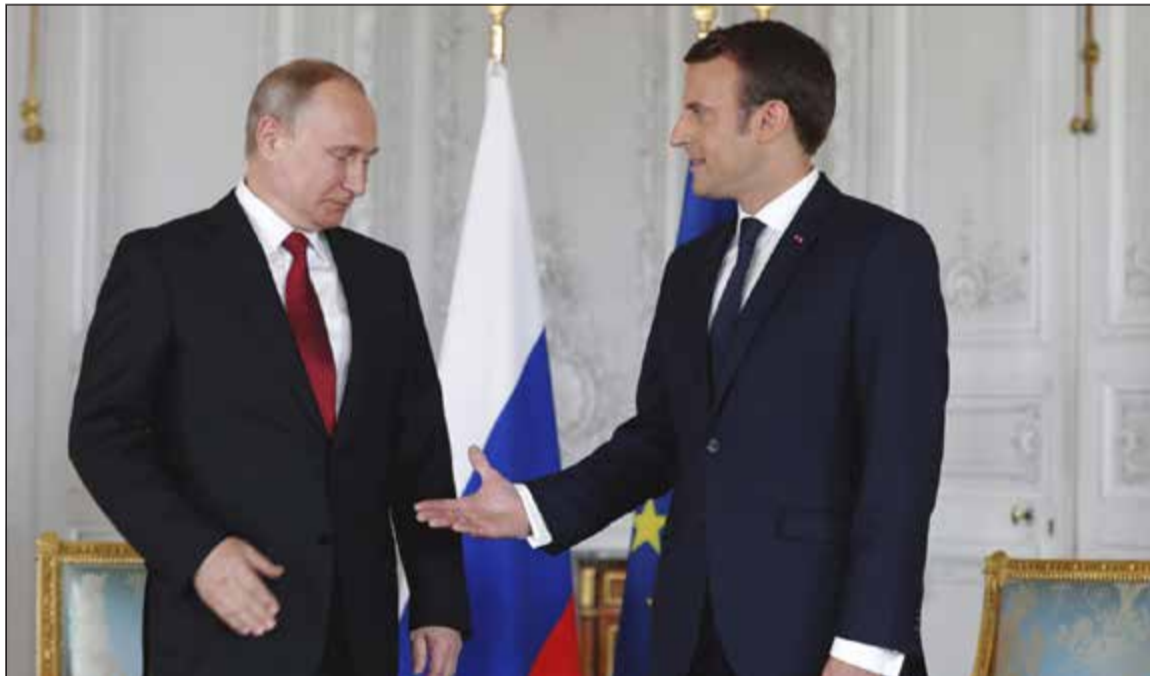
الرئيس الفرنسي إيمانويل ماكرون ونظيره الروسي فلاديمير بوتين قبيل مباحثاتهما الثنائية في قصر فرساي امس

باريس - وكالات: استقبل الرئيس الفرنسي إيمانويل ماكرون امس نظيره الروسي فلاديمير بوتين بقصر فرساي، وذلك في أول زيارة لرئيس أجنبي إلى باريس منذ انتخاب الرئيس ماكرون في 7 مايو الجاري.