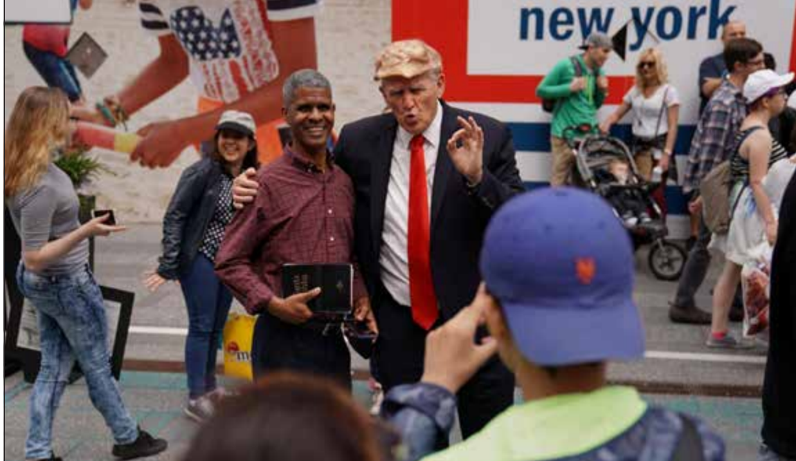
شبيه الرئيس الأميركي دونالد ترامب يلتقط صورة تذكارية في مانهاتن امس الاول

واشنطن - وكالات: شن الرئيس الأميركي دونالد ترامب هجوما معاكسا على وسائل الإعلام المحلية التي تحدثت عن صهره جاريد كوشنر لإقامة قناة اتصال سرية مع الكرملين. وصور عودته من جولة خارجية استمرت 9 أيام شملت الشرق الأوسط وأوروبا، رد ترامب في سلسلة تغريدات على الاتهامات بحق صهره ومستشاره المقرب، واصفا ما تداولته وسائل الإعلام في هذا الصدد بأنه «أكاذيب».