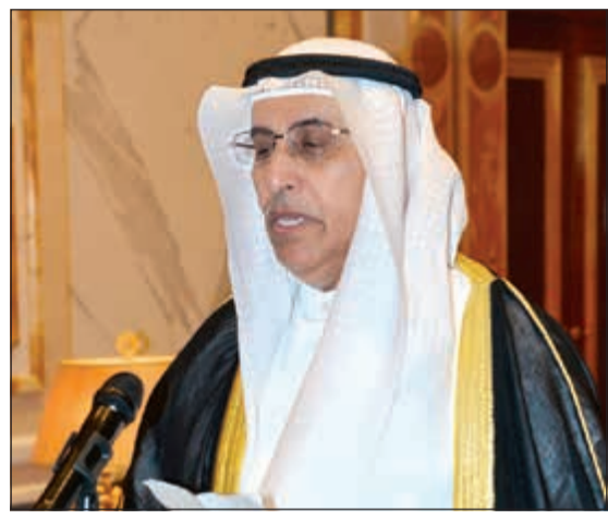
المستشار علي المطيرات يؤدي اليمين الدستورية

الامارات العربية المتحدة على هذه المبادرة الكريمة التي تجسد عمق العلاقات بين البلدين الشقيقين مبادلا سموه التهاني بهذه المناسبة العطرة و متمنيا استمرار هذا التواصل الأخوي مبتهلا الى الباري تعالى أن ينعم على سموه بدوام الصحة والعافية ويحقق لدولة الامارات العربية المتحدة الشقيقة كل ما تتطلع اليه من رفعة و رقي وازدهار في ظل القيادة الحكيمة لأخيه صاحب السمو الشيخ خليفة بن زايد آل نهيان رئيس دولة الامارات العربية المتحدة الشقيقة.