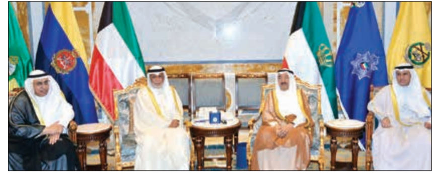
صاحب السمو الأمير الشيخ صباح الأحمد مستقبلاً المستشارين يوسف المطاوعة وعلي المطيرات بحضور د. فالح العزب

الامارات العربية المتحدة على هذه المبادرة الكريمة التي تجسد عمق العلاقات بين البلدين الشقيقين مبادلا سموه التهاني بهذه المناسبة العطرة و متمنيا استمرار هذا التواصل الأخوي مبتهلا الى الباري تعالى أن ينعم على سموه بدوام الصحة والعافية ويحقق لدولة الامارات العربية المتحدة الشقيقة كل ما تتطلع اليه من رفعة و رقي وازدهار في ظل القيادة الحكيمة لأخيه صاحب السمو الشيخ خليفة بن زايد آل نهيان رئيس دولة الامارات العربية المتحدة الشقيقة.