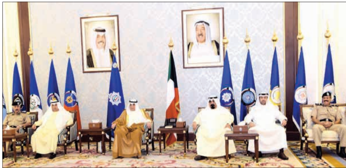
الشيخ خالد الجراح متوسطا قيادات وزارة الداخلية خلال حفل الاستقبال

أكد نائب رئيس مجلس الوزراء ووزير الداخلية الشيخ خالد الجراح أن المؤسسة الأمنية ستظل دائما على العهد مجددة الولاء لصاحب السمو الأمير الشيخ صباح الأحمد، وسمو ولي العهد الشيخ نواف الأحمد، وسمو رئيس مجلس الوزراء الشيخ جابر المبارك.