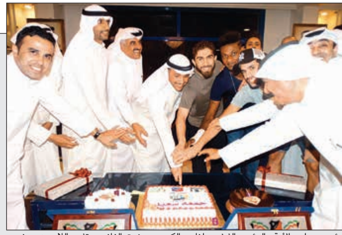
رئيس مجلس الأمة والرئيس الفخري لنادي الكويت مرزوق الغانم يحققي بالاعيين بحضور رئيس النادي عبدالعزيز المرزوق

الغانم يشكر الاعيين الخطيب والرحيلي لدورها في الإنجاز التاريخي للأبيض 26