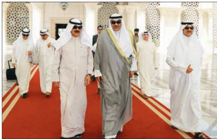
الشيخ صباح خالد الخالد أثناء مغادرته إلى مدينة نيويورك للمشاركة في أعمال جلسة الجمعية العامة للأمم المتحدة وفي وداعه خالد الجارالله

وأشار المصدر إلى أن جدول الأعمال كان مقرراً فيه مناقشة وإقرار تقارير لجنة الميزانيات والحسابات الختامية لعشر جهات حكومية ملحقه ومستقلة، موضحاً أنه تم ترحيل الجلسة إلى غد الأربعاء على أن تكون جلسة الخميس امتداداً لجلسة الغد.