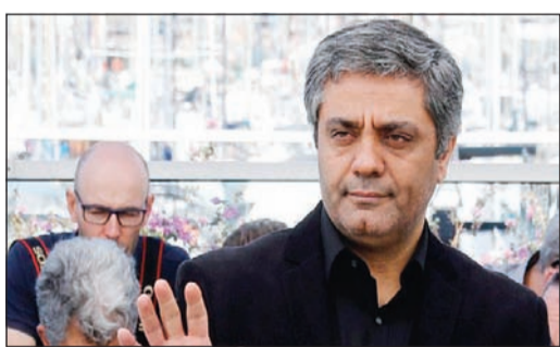
المخرج الإيراني محمد رسولوف

ثورمان ثلاث جوائز أخرى مساء السبت، فكانت جائزة لجنة التحكيم من نصيب فيلم «لاس إيكس دي ايريل» للمكسيكي ميشال فرانكو، فيما نال «ويند ريفر» للاميركي تابلور شيريدان جائزة الإخراج و«باربرا» للفرنسي ماتيو امالريك جائزة الشعاعية السينمائية. وكوفئت الممثلة جازمين تريونكا عن دورها في فيلم «فورتوناتا» للإيطالي سيرجيو كاستيليتو.