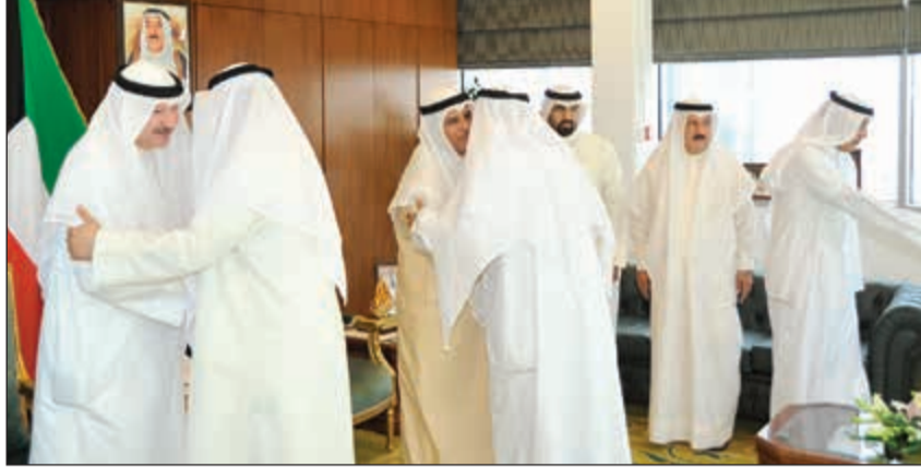
وزير العدل ووزير الدولة لشؤون مجلس الأمة د.فالح العزب والوكيل عبدالعزيز السريع خلال استقبال المهنيين