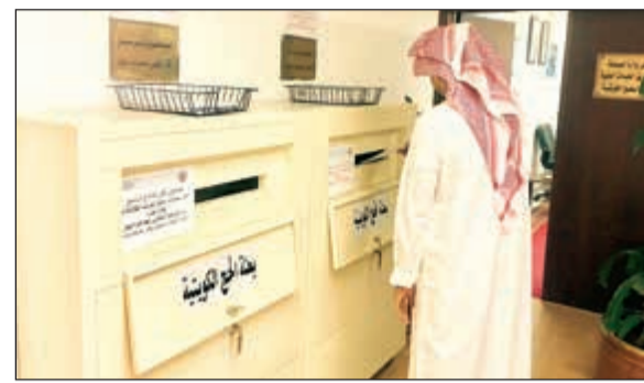
أحد الموظفين يضع طلب الالتحاق في الصناديق المخصصة لذلك

المسمى الوظيفي (مسجل فما فوق). أما بالنسبة لـ «الصيدال» التمريض التفتيش الصحي فبني الطوارئ الطبية، فيجب ان يكونوا حاصلين على دبلوم دراسي في التخصص فما فوق، وان يكونوا عاملين في وزارة الصحة ولديهم ترخيص مزاول مهنة ساري المفعول، أما الإداريون فيجب ان يكونوا موظفين بوزارة الصحة بمدة لا تقل عن 5 سنوات خبرة، علما بان المستندات المطلوبة هي «صورة عن البطاقة المدنية صورة ترخيص مزاول المهنة 2 صورة ضوئية خلفية بيضاء صورة من جواز السفر». وبالنسبة للكادر الطبي لحملات الحج الكويتية، فقد اشترطت الوزارة ان يكون الكادر من الطبيبات والممرضات اللاتي لا تقل اعمارهن عن 45 عاما وان يكون لديهن محرم مرافق للحملة. وقامت وزارة الصحة بتوزيع النماذج المخصصة لهذا الغرض على جميع المناطق الصحية والإدارات المركزية والمستشفيات والمراكز التخصصية والصحية، وبقيّة مرافق الوزارة لاستيفائها خلال الفترة المقررة واعتمادها من المدير المختص، علما انه سيتم تقييم استمارات الترشيح من قبل رئيس فريق الخدمات الطبية ورؤساء مجموعات العمل لاختيارهم.