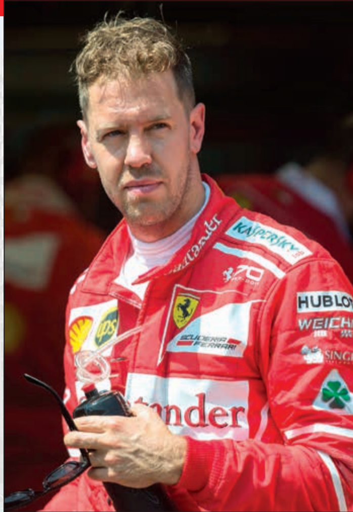
سائق فيراري الألماني سيباستيان فيتل

ويتسم سباق موناكو أيضاً بشيء خاص حيث يتخذ العديد من سائقي فورمولا 1 من موناكو مقراً لإقامتهم ومن بينهم البريطاني جنسون باتون بطل العالم سابقاً والذي يعود للسباقات من خلال سباق الغد، حيث يحل مكان الإسباني فيرناندو ألونسو سائق مكلارين الذي اعتذر عن عدم المشاركة مع فريقه في هذا السباق لخوض سباق إنديانابوليس ضمن فعاليات سلسلة «إندي 500».