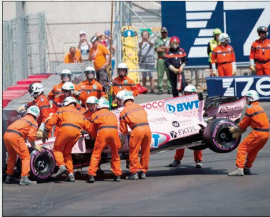
سيارة السائق الفرنسي سيباستيان كون بعد تعرضها للحادث وازالتها من الحلبة

واعترت كيهام ما قامت به المجلة «غير مسؤول» و«ليس صحياً»، مضيفة «تخمينات من هذا النوع غير مسؤولة، لأنه نظراً إلى خطورة أصابته، الخصوصية أمر مهم للغاية بالنسبة لميكايل. للأسف، هم أعطوا أيضاً عدداً من الناس المعنيين (بوضع شوماخر) أملاً خاطئاً»، متمنية «أن يعود يوماً ليكون متواجداً بيننا».