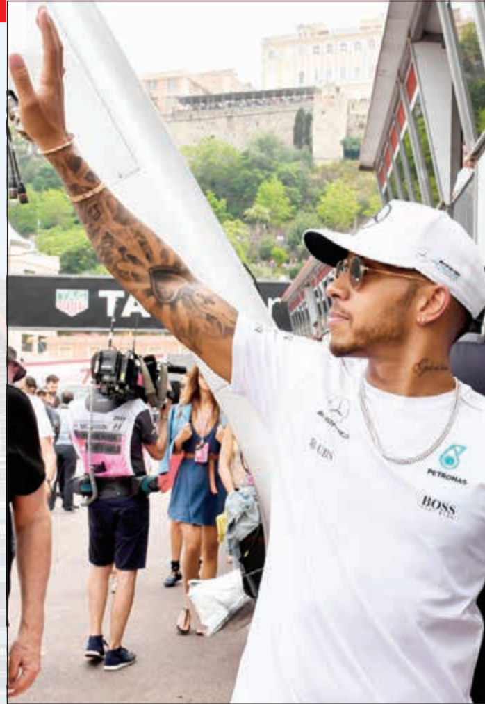
سائق مرسيدس البريطاني لويس هاميلتون

سجل الألماني سيباستيان فيتل سائق فيراري ومتصدر الترتيب العام أسرع زمن في جولة التجارب الحرة الثالثة والأخيرة في سباق جائزة موناكو الكبرى الجولة السادسة من بطولة العالم لسباقات فورمولا 1 للسيارات أمس السبت وتفوق تماماً على منافسه على اللقب البريطاني لويس هاميلتون سائق مرسيدس. وسجل فيتل أسرع زمن على الإطلاق على الحلبة وهو دقيقة واحدة و12,395 ثانية متفوقاً بفارق 0,345 ثانية على زميله الفنلندي كيمي رايكونن الذي احتل المركز الثاني في أجواء مشمسة في الإمارة المطلة على البحر المتوسط. واحتل هاميلتون الذي يتخلف بست نقاط عن فيتل المركز الخامس بفارق 0,835 ثانية عن سائق فيراري المتصدر في حين احتل سائق مرسيدس الثاني الفنلندي فاليري بوتاس المركز الثالث مباشرة قبل الهولندي الشاب ماكس فرستابن (19 عاماً) سائق رد بول.