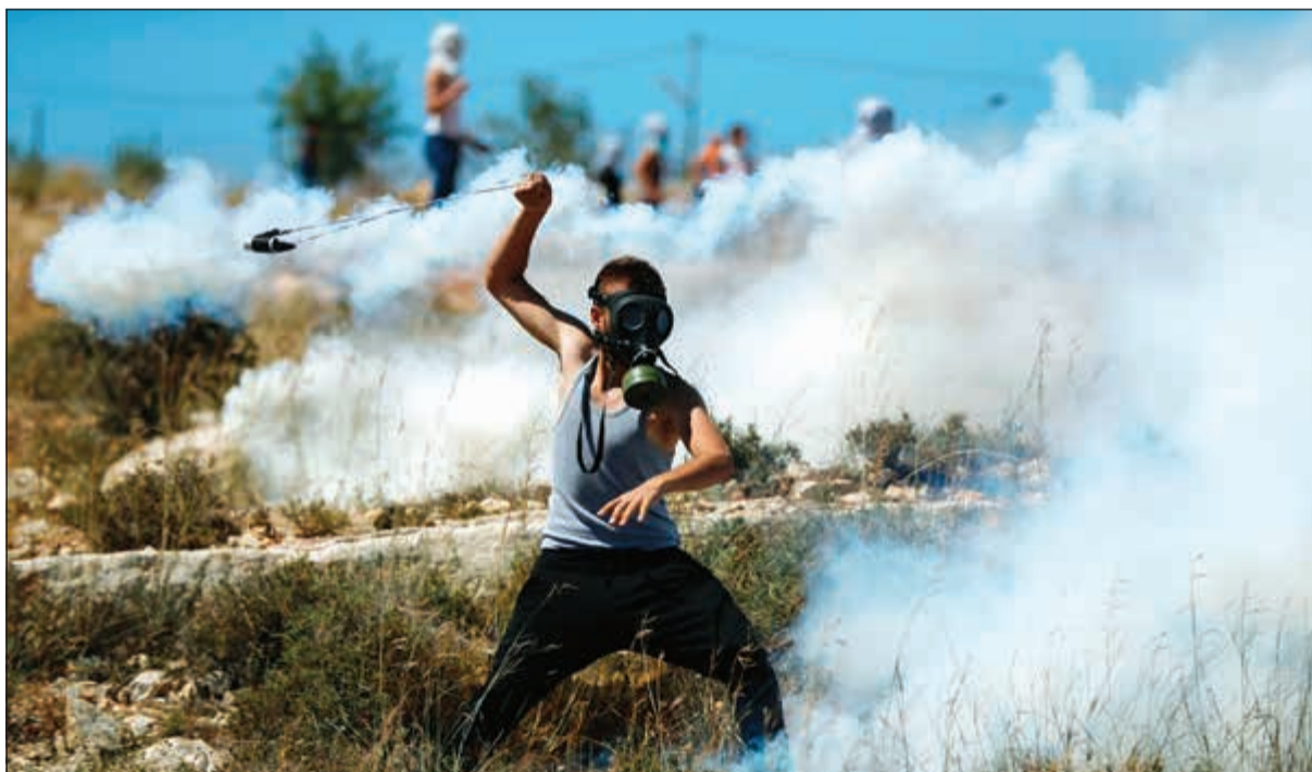
شاب فلسطيني بعيد قذف قبلة مسيلة للمدوم باتجاه قوات الاحتلال خلال مواجهات في رام الله امس

عواصم - وكالات: علق مئات الأسرى الفلسطينيين المضربين عن الطعام في سجون الاحتلال الإسرائيلية إضرابهم الذي بدأه في 17 أبريل الماضي، للمطالبة بتحسين أوضاعهم الحياتية داخل هذه السجون.