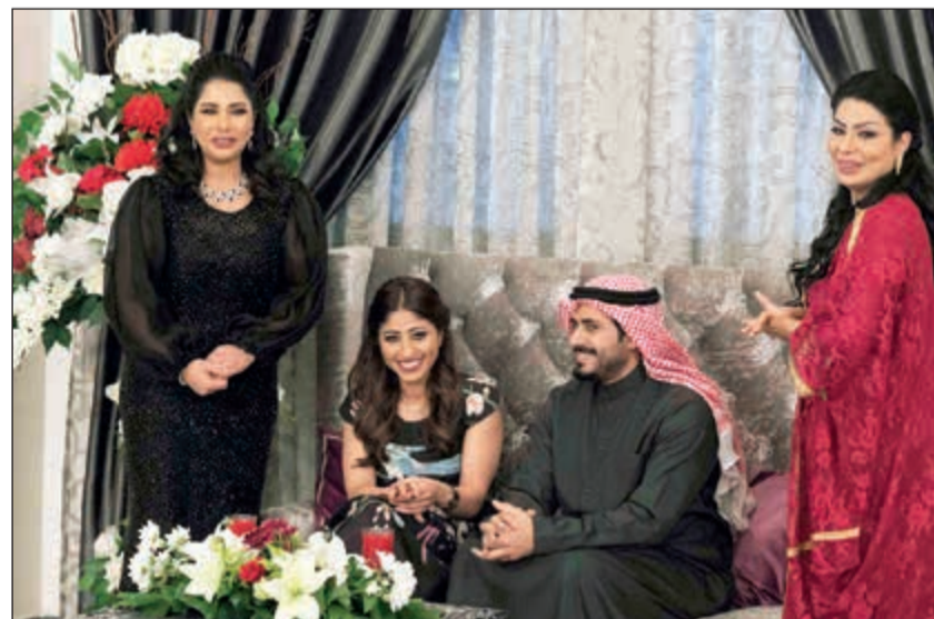
مشهد من «اليوم الأسود»

في عمله المقبل، كما قال «طريقة كتابة جديدة»، مفسحا المجال للجمهور ليبحث عن إجابة حول علاقة اسم المسلسل بالاحداث، وهذا ما سنعرفه بمتابعة العمل على قنوات «ام بي سي دراما»، «الظفرة»، «الراي»، «سما دبي»، و«روتانا خليجية».