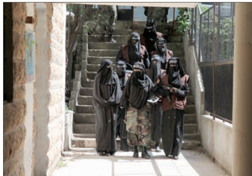
مسلسل «غرايب سود»

الارهابي وممارساته اللانسانية. وقد اهتمت به وسائل الاعلام العربية والغربية، وركزت على اهتمامه بإبراز وجهة النظر النسائية في التنظيم الارهابي اكثر من الرجالية، حيث تعرضت الكثرات للوقوع في براثنه والهلاك مع من هلك.