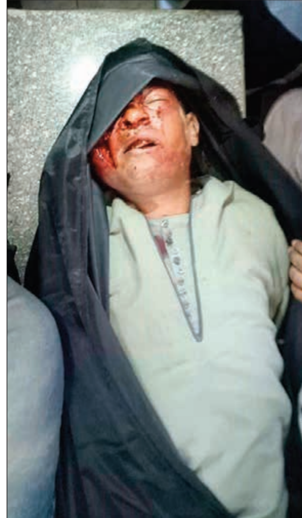
أحد ضحايا العمل الإرهابي الخسيس الذي ضرب أقباط صعيد مصر