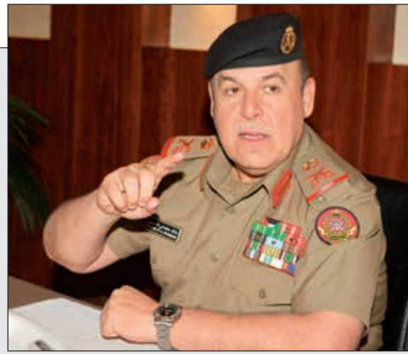
اللواء الركن خالد الشمري يجيب عن أسئلة قراء «الأنباء» (قاسم باشا)

معاون رئيس الأركان لهيئة الإدارة والقوة البشرية اللواء الركن خالد الشمري لقراء «الأنباء»: فرزنا 3700 متطوع من 28 ألفاً.. ولا استثناءات بالجيش حاجة الجيش إلى تطوع أبناء العسكريين غير الكويتيين.. شائعات 08 و09