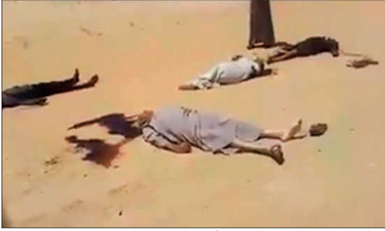
ضحايا العمل الإرهابي الخسيس الذي ضرب أقباط صعيد مصر

من جانبه، أدان الرئيس الفلسطيني محمود عباس الهجوم الإرهابي، فيما أدان رئيس مجلس الوزراء اللبناني سعد الحريري الاعتداء الذي يخالف المبادئ والقيم الدينية والأخلاقية، كما ندد العاهل الأردني الملك عبدالله الثاني بالهجوم البشع، معرباً عن «إدانتته الشديدة لهذا العمل الجبان». هذا، وأدانت الحكومة الألمانية بشدة الهجوم وقالت: «هذا النوع من الإرهاب ضد أتباع عقائد مغايرة مخيف ومفزع وما هو إلا مأساة». بدوره، أعلن الأمين العام لجامعة الدول العربية أحمد أبو الغيط تضامنه مع قيادة وحكومة وشعب مصر في مواجهة «الجرائم الإرهابية الشنيعة التي تستهدف الأبرياء وتستتبع الحرمات بما في ذلك حرمة شهر رمضان الفضيل».