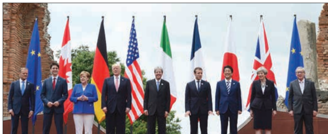
صورة جماعية لقيادة مجموعة السبع الصناعية قبيل اجتماعهم في إيطاليا أمس

تحت مجهر مكتب التحقيقات الفيدرالي (اف. بي. أي) حالياً، باعتباره أحد الأشخاص المحتمل ضلوعهم في القضية. ويعتقد المحققون أن كوشنر لديه معلومات مهمة تتعلق بتحقيقهم في التدخل الروسي، من دون أن يعني ذلك أنه موضع شبهات بارتكاب جنحة، ويريد المحققون معرفة المزيد عن سلسلة اجتماعات شارك فيها كوشنر، خصوصاً مع السفير الروسي في واشنطن سيرغي كيسلياك ومصرفي روسي.