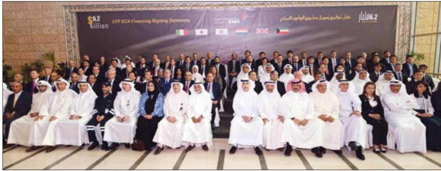
لقطة جماعية يتصدرها نزار العديسي الرئيس التنفيذي لمؤسسة البترول الكويتية ومحمد غازي المطيري الرئيس التنفيذي لشركة البترول الوطنية وجمال جعفر الرئيس التنفيذي لشركة نفط الكويت