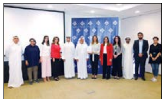
لجنة جماعية لمسؤولي شركة مزايا مع فريق إنجاز الكويت

البرامج التعليمية الموجهة للشباب، إلى جانب سعيها المستمر نحو تعزيز مهارات القيادة والثقة بالنفس لديهم، وكذلك تطوير الخبرة التي تجعل منهم قادة للمستقبل في جميع القطاعات.