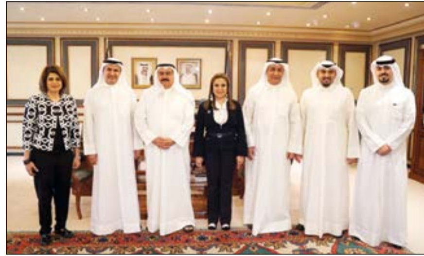
صورة جماعية للإدارة التنفيذية في بنك الكويت الوطني مع محافظ العاصمة الفريق ثابت المهنا

رائدة في خدماتها ودورها الحيوي والتنموي المميز. وبدوره، أثنى المحافظ على الدور الذي يقوم به بنك الكويت الوطني في المسؤولية الاجتماعية، وأشاد بالجهود الكبيرة للبنك والذي نجح في الحفاظ على دوره الريادي في خدمة المجتمع بموازاة عراقه تاريخه المصرفي والمالي محلياً وإقليمياً، كما أكد مواصلة الجهود والتعاون المشترك لما فيه مصلحة المجتمع وخدمة القضايا الاجتماعية والإنسانية والخيرية أينما استدعت الحاجة.