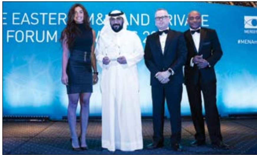
مثل كامكو متسلماً الجائزة

أعلنت شركة كامكو للاستثمار عن فوزها بلقب «أفضل مدير إصدار لللكوك في الشرق الأوسط 2017»، من قبل «ميرجر ماركت» الرائدة في مجال الأخبار والبحوث العالمية في قطاعات الدمج والاستحواذ، وأسواق الدين. وقد حازت كامكو هذه الجائزة في فئة إصدارات أدوات الدين المتوافقة مع الشريعة الإسلامية بناء على عدد من المعايير الفنية التي تشمل تحليل الأداء العام للقطاع، وتقييم الخدمات الاستثمارية المصرفية، وبتعلق بدورها الناجح في إصدارات الصكوك خلال الفترة الماضية.