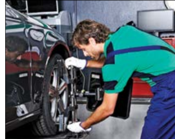
فحص ميزانية العجلات

قد يزيد نسبة فقدان. وبالإضافة إلى أن انخفاض ضغط الإطارات يتسبب في سرعة التآكل، فإن الإطارات ذات الضغط المنخفض يتولد عنها حرارة أكثر، نظراً لزيادة الاحتكاك، مما يؤثر أيضاً على أداء السيارة، بما في ذلك كفاءة الكابح، والتحكم، والسلامة، واستهلاك الوقود.