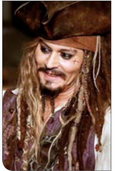
جوني ديب في «ديزني لاند»

فاجأ النجم العالمي جوني ديب زوار «ديزني لاند»، عندما أطل عليهم، السبت الماضي، مرتديا ملابس شخصية «جاك سبارو» الشهيرة التابعة لسلسلة أفلام «قراصنة الكاريبي»، وذلك في إطار تسويقه للجزء الجديد من السلسلة المزمع عرضه قريبا، وبمجرد أن اكتشف الزوار الذين كانوا يستقلون المراكب أنه النجم جوني ديب الحقيقي، أخذوا يصرخون «أه جوني ديب» ولم تتوقف كاميرات الحضور عن تصوير اللحظات التي لا تنسى معه.