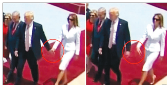
لقطتان تجسدان الواقعة الغريبة لزوجته ترامب وهي تدفع يده بعيداً فيما بدا أنه خلاف كبير بينهما

عواصم - وكالات: دعا الرئيس الأميركي دونالد ترامب امس في القدس المحتلة الجانبين الإسرائيلي والفلسطيني إلى تقديم تنازلات من أجل السلام واتخاذ «القرارات الصعبة» التي يترتب عليها الأمر. وقال ترامب في خطاب ألقاه في متحف إسرائيل بحضور رئيس الوزراء الإسرائيلي بنيامين نتنياهو «صنع السلام لن يكون سهلاً». وبحسب ترامب، فإن «الجانبين سيواجهان قرارات صعبة، ولكن مع التصميم والتنازلات والاعتقاد بأن السلام ممكن، يستطيع الإسرائيليون والفلسطينيون التوصل إلى اتفاق». وتعهد ترامب مرة أخرى بأنه «ملتزم شخصياً» بمساعدة الجانبين على التوصل إلى اتفاق لإنهاء الصراع المستمر منذ قرابة 70 عاماً. من جهة أخرى، وفي واقعة شديدة الغرابة، دفعت زوجة الرئيس الأميركي دونالد ترامب، يد زوجها بعيداً بعد محاولته الإمساك بيدها، وتناقلت صحف أميركية وعالمية فيديو «الدفعة»، متسائلة عن السبب الذي من شأنه أن يدفع ميلانيا لرفض إمساك يد زوجها. ويظهر مقطع الفيديو الذي انتشر على وسائل التواصل الاجتماعي ما بدا أنه خلاف بين الرئيس الأميركي، وزوجته، بعد نزولهما من الطائرة في إسرائيل. وتساءلت وسائل الإعلام، هل حدث خلاف على متن الطائرة الرئاسية قبل أن تحط في تل أبيب؟ واستنتجت الصحف أن العلاقة بين الزوجين يبدو أنها لا تسير على ما يرام، وأشار خبراء إلى أن هناك تناقراً في الفترة الأخيرة بين الزوجين، «ترجمة النشرة» وليست هذه المرة الأولى التي تتحدث فيها الصحافة عن مشاكل أسرية في العائلة الرئاسية. التفاصيل ص 41