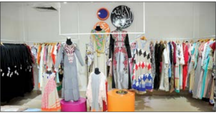
قسم الدراعات في المعرض