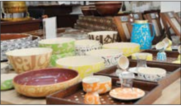
تشكيلات من الأواني المنزلية