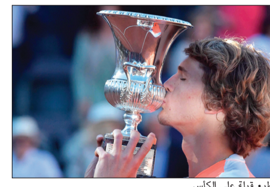
زفيريف يطبع قبلة على الكأس

أحرز الألماني ألكسندر زفيريف لقبه الأول في دورات الماسترز للالاف نقطة في كرة التنس بفوزه على الصربي نوفاك ديوكوفيتش المصنف ثانياً 6-4 و3-6 في المباراة النهائية لدورة روما. وخاض زفيريف (20 عاماً) والمصنف 17 عالمياً، النهائي الثالث له في دورات الألف نقطة، وهو أصغر لاعب يخوض المباراة النهائية في إحدى هذه الدورات منذ عشرة أعوام، علماً أن ديوكوفيتش كان الأصغر قبله عندما بلغ نهائي دورة ميامي 2007 وأحرز لقبها بعمر 19 عاماً. كما أحرزت الأوكرانية يلينا سفيتولينا المصنفة ثامنة لقب فئة السيدات بفوزها على الرومانية سيمونا هاليب السادسة 6-4 و5-7 و6-1 في المباراة النهائية أمس.