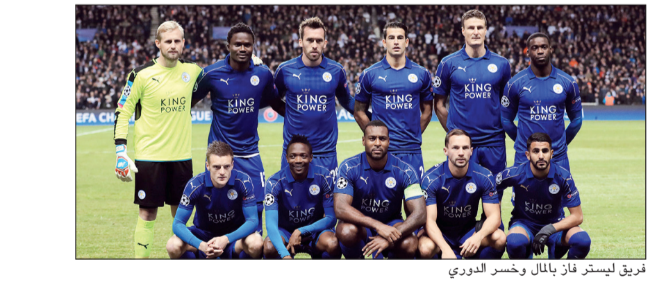
فريق لستر فاز بالمال وخسر الدوري

التي حققها الفريق خلال منافسات البطولة، مع تضمين 38 مليوناً و720 ألف جنيه تمثل حصته من حقوق البث التلفزيوني لمبارياتي، أما نادي أرسنال فحقق عائدات تقدر بـ 52,86 مليون باوند إسترليني تشمل 10,76 ملايين باوند نظير مشاركته في البطولة، و2,12 مليوناً نظير تأهله إلى الدور ثمن النهائي، مضافاً إليها 29,9 مليون باوند نصيبه من حقوق البث التلفزيوني لمبارياته. وبلغت إيرادات نادي توتنهام هوتسبير 35,42 مليون جنيه إسترليني، تشمل مكافأة مشاركته في البطولة القارية، ومعها 3 ملايين و560 ألف باوند مكافأة على ما حققه من نتائج في مباريات دور المجموعات، و21,1 مليون جنيه تمثل حصته من البث التلفزيوني لمبارياته. وحقق خزيمة نادي مان سيتي عائدات تقدر بـ 40,85 مليون باوند إسترليني شملت مكافأة المشاركة في البطولة، ومعها 11 مليون باوند تمثل عائدات بلوغه الدور ثمن النهائي، ونحو 20 مليون باوند حصته من البث التلفزيوني. ومن المعلوم أن الاتحاد الأوروبي لكرة القدم قد وضع سلماً خاصاً لتقسيم الأرباح السنوية التي تحققها مسابقة دوري أبطال أوروبا على الأندية المشاركة، والتي تختلف من نادٍ لآخر بحسب النتيجة النهائية التي حققها في البطولة، وبحسب عدد الانتصارات التي سجلها خلال المنافسات، إذ إن الانتصار المحقق يرفع من عائدات صاحبه حتى في حال أقصى.