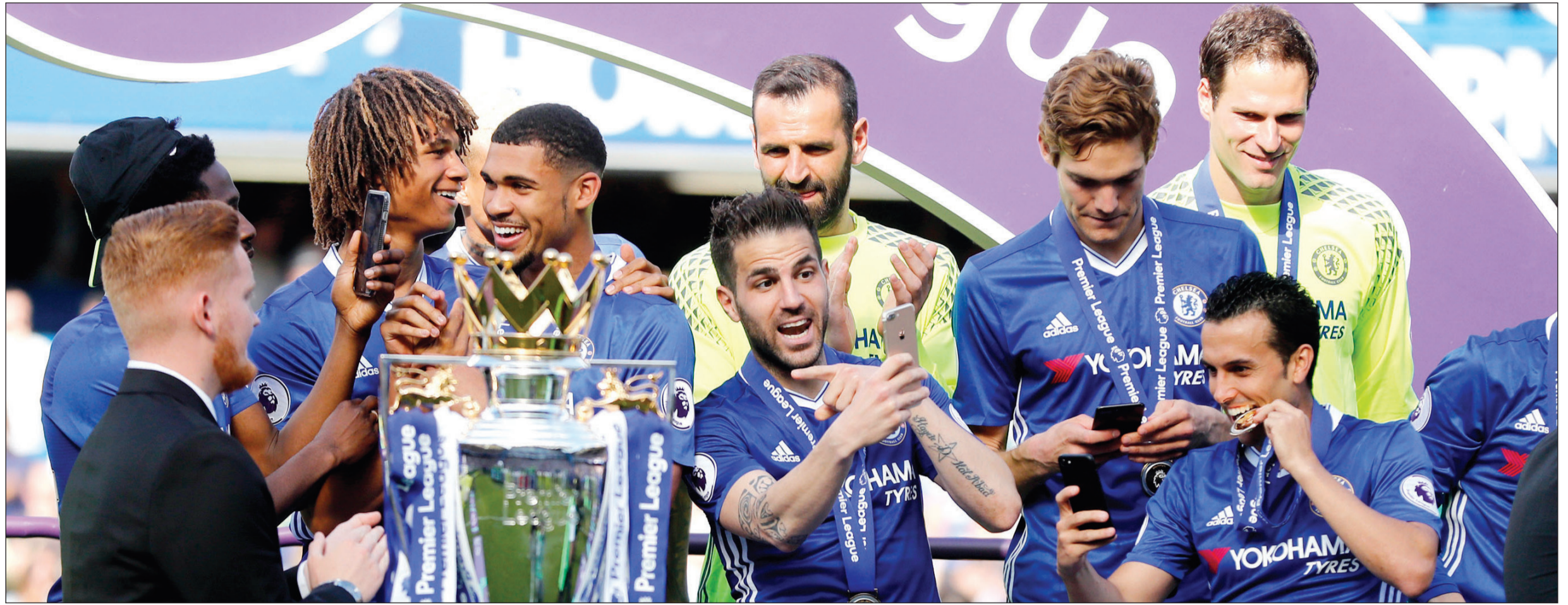
فرحة نجوم تشلسي بلقب الدوري الإنجليزي لموسم 2016 - 2017

بأمجد البطولات الأوروبية على مستوى الأندية. ورفع أرسنال رصيده إلى 75 نقطة في المركز الخامس، ليتأهل إلى مرحلة المجموعات مباشرة لبطولة (يوروبا ليغ) في الموسم القادم، فيما توقف رصيده إيفرتون عند 61 نقطة في المركز السابع، الذي يصعد بصاحبه للعب الدور التمهيدي المؤهل لمرحلة المجموعات لبطولة ذاتها.