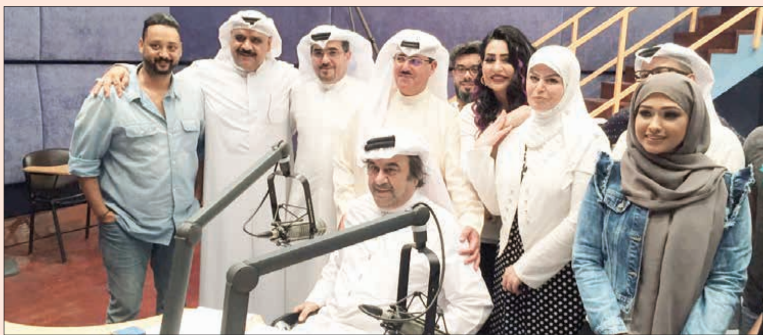
مفرح الشمري @Mefrehs

حقق الوكيل المساعد لقطاع الإذاعة الشيخ فهد المبارك الصباح رغبة الفنان القدير عبدالحسين عبدالرضا بتغيير اسم مسلسله الإذاعي «عزوبي المول»، الذي كتبتة أميرة نجم وأخرجه اسامة المزيعل، ليصبح «مول الهوايل»، بعد أن طلب ذلك الفنان القدير عبدالحسين عبدالرضا أثناء تسجيل حلقات المسلسل حتى لا يتشتت المستمع معه ومع اسم مسرحيته «عزوبي السالمية»، خصوصا أن أحداث المسلسل تدور حول مول في منطقة السالمية. من جانب آخر، انتهى الفنان القدير عبدالحسين عبدالرضا من تسجيل صوته على المقدمة الغنائية الخاصة بالمسلسل ويشاركه الغناء مطرب الشباب مطرف المطرف، الذي اعتبر هذا التعامل مع أسطورة الفن الكويتي عبدالحسين عبدالرضا إضافة كبيرة لمشواره الغنائي. المقدمة الغنائية كتبها الشاعر الهادر ولحنها فهد الناصر ووزعها منتظر، وهي