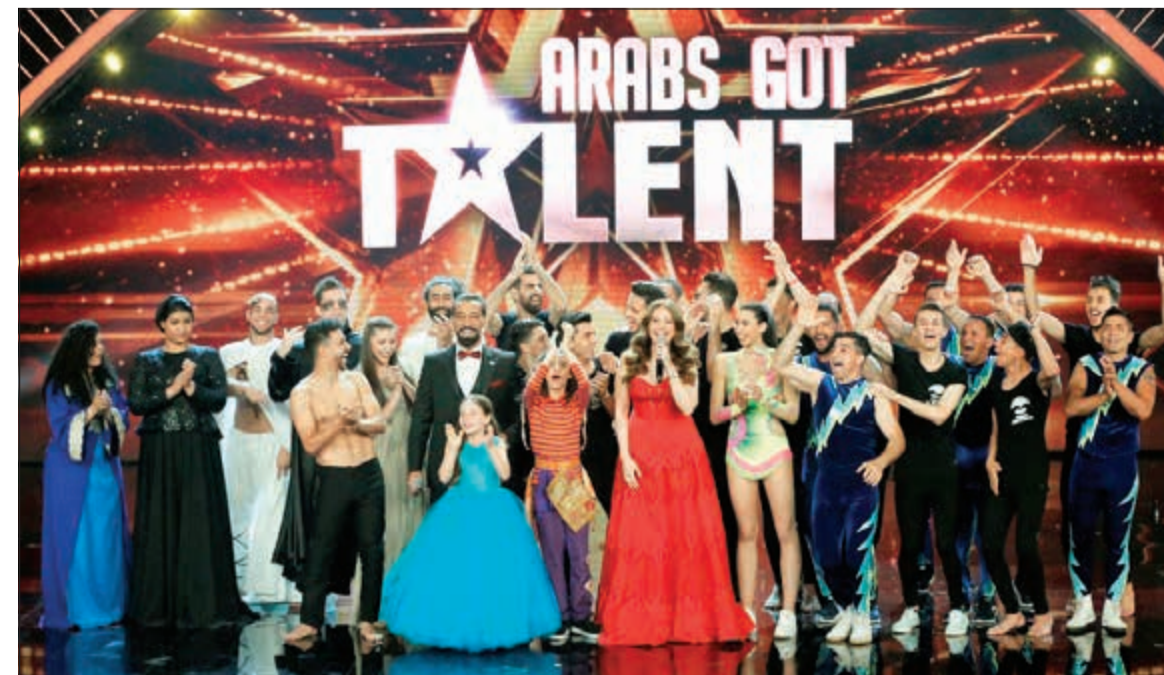
المتسابقون لحظة إعلان النتائج