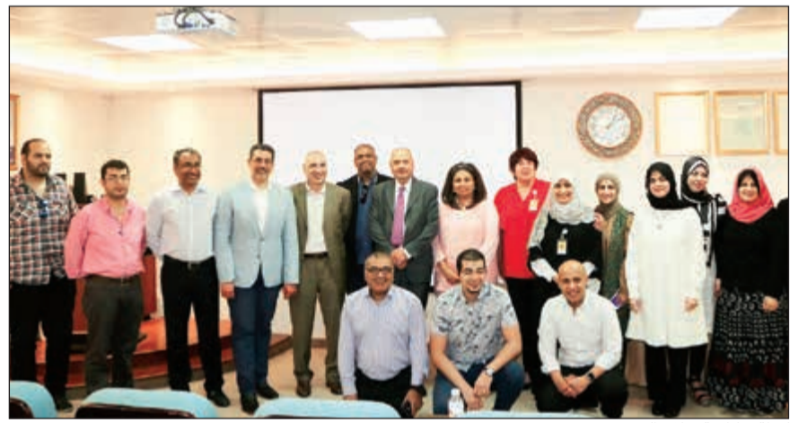
لقطة تذكارية خلال الدورة

وكيلها المحلي شركة السلطان الطبية المتحدة. وتتمثل مهمة معهد علوم التصوير الطبي في إطلاق برامج تعليمية تتضمن دورات وورش عمل في مجال الأشعة يتم تقديمها من قبل خبراء شركة سيمينز الألمانية لفريق العمل داخل مركز التصوير التشخيصي في المستشفى بشكل خاص بالإضافة إلى فنيي وأطباء الأشعة على المستوى المحلي والإقليمي بشكل عام وذلك بصورة غير ربحية، الأمر الذي يرضح مزيداً من الكفاءات والخبرات العلمية للحقل الطبي في الكويت مما يعزز من كفاءة وجودة الخدمات المقدمة للمرضى والتي تغنيهم عن السفر للخارج لتلقي الرعاية الصحية.