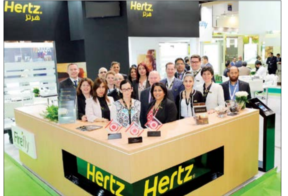
فريق عمل هرتز

الفوز للسنة الثالثة على التوالي وارتفاع رصيدها إلى 5 جوائز