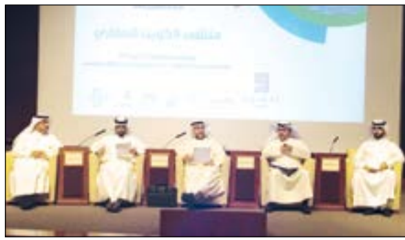
جانب من ملتقى الكويت العقاري

وقال إن هناك في الكويت 140 ألف سكن خاص تبلغ قيمتها الإجمالية 50 مليار دينار، مشدداً على أهمية إصدار قانون الرهن العقاري والا تكون الحكومة وصية على المواطنين وإنما عليها أن توفر لهم الخيارات وتترك لهم حرية الاختيار، وأوضح الجراح أن من إيجابيات «الرهن العقاري» تحول المواطن من تاجر السكن الخاص إلى التملك.