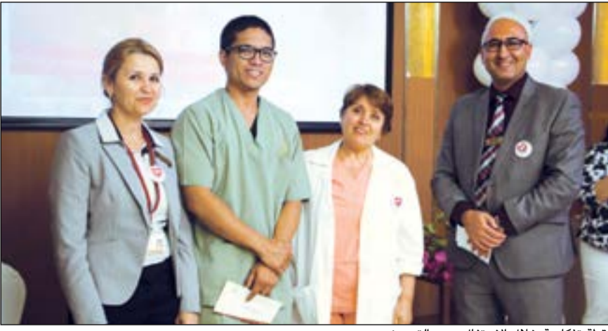
لقطة تذكارية خلال الاحتفال بيوم التمريض

احتفل مستشفى رويال حياة كعادته بإنجازات وتفاني الطاقم التمريضي في اليوم العالمي للمرضى والمرضات 16 مايو 2017 في قاعة الجوري. وقد حرص مستشفى رويال حياة ممثلاً بدائرة التمريض، الكادر التمريضي بهذه المناسبة على إحياء حفل ضم فعاليات من الطاقم التمريضي والطبي بالإضافة إلى إدارة المستشفى والعاملين بها.