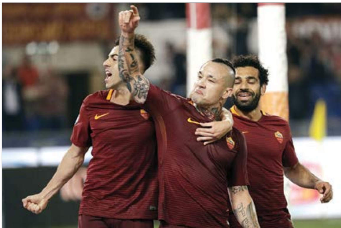
فرحة لاعبي روما بإسقاط يوفنتوس

رفض روما أن يعود يوفنتوس من العاصمة وهو متوج باللقب فأسقطه بالفوز عليه 3-1 أول من أمس في المرحلة السادسة والثلاثين على الملعب الأولمبي. واكتسبت مواجهة أهمية بالغة بالنسبة إلى الفريقين، لأن روما يتصارع مع نابولي على المركز الثاني المؤهل مباشرة إلى دوري أبطال أوروبا، بينما كان يوفنتوس في حاجة إلى نقطة التعادل من أجل حسم لقبه السادس على التوالي والتفرغ بعدها لنهائي مسابقتي الكأس ودوري الأبطال. وتاجل حسام الملقب بالنسبة ليوفنتوس إلى المرحلة المقبلة قبل الأخيرة حيث يلتقي كروتوني على أرضه الأحد المقبل، لكن عليه أولاً زيارة الملعب الأولمبي مجدداً الأربعاء لمحاولة الفوز مرة أخرى بلقب مسابقة الكأس المحلية حيث سيتواجه مع طيب العاصمة الآخر لاتسيو الذي أقصى جاره في نصف نهائي المسابقة. أما بالنسبة لروما الذي ألحق بيوفنتوس هزيمته الخامسة هذا الموسم وحرمه من العودة إلى سكة الانتصارات (تعادل) في المرحلتين السابقتين مع اتالانتا وجاره تورينو)، فحافظ على المركز الثاني الذي انتزعه منه نابولي مؤقتاً بفوزه الكاسخ على ضيفه تورينو 5-0.