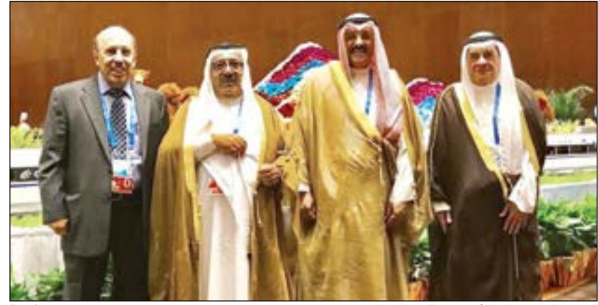
الشيخ ناصر صباح الأحمد مع الوفد المشارك (كويتا)

كونا: أكد وزير شؤون الديوان الأميري وعضو المجلس الأعلى للتخطيط والتنمية الشيخ ناصر صباح الأحمد أمس أهمية مبادرة «الحزام والطريق» في تعزيز التنمية المشتركة وتحقيق الأمن والسلام وفتح آفاق التعاون والعلاقات بين دول العالم. وقال رئيس الوفد الكويتي إلى المنتدى الشيخ ناصر الذي يتأسس الوفد الكويتي في كلمته أمام «منتدى قمة الحزام والطريق للتعاون الدولي» إن الكويت والصين كانتا تباحثان منذ أكثر من ربع قرن لإحياء طريق الحرير القديم إلا أن الرئيس الصيني شي جين بينغ هذب الرؤى وأضاف عليها رونقا وفعالية عملية قابلة للتنفيذ وساهم في إعادة تشكيل الجغرافيا الاقتصادية والاستثمارية والتجارية وتحقيق التنمية المشتركة والتكامل بين جميع القارات فضلا عن ربط مشاريع البنى التحتية للعالم وتحسين نموها وتطورها الاقتصادي. وأكد الشيخ ناصر أن هناك تلاقحاً عميقاً بين رؤية «الكويت 2035» ومبادرة الصين «الحزام والطريق» المتعلقة بإحياء طريق الحرير